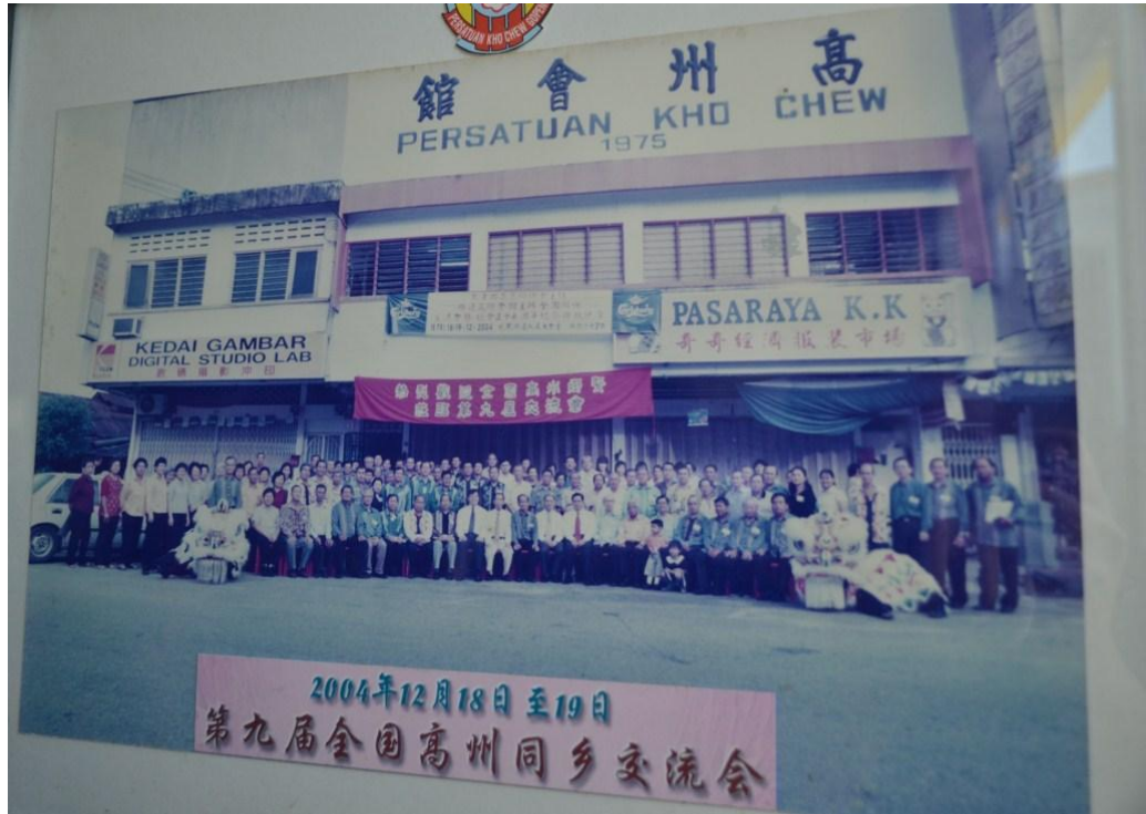
图五：2004年第九届全国高州同乡交流会