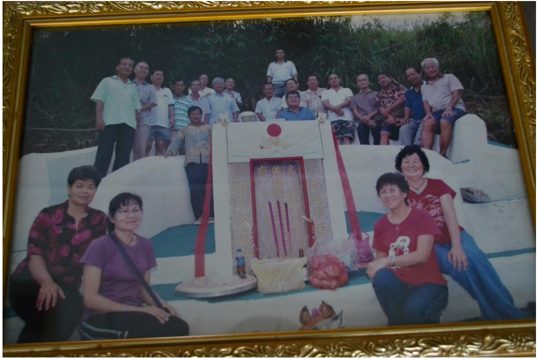
图十一：旧高州总坟