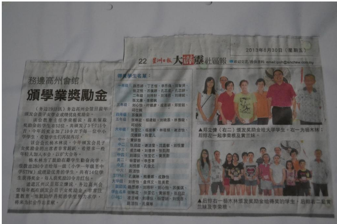
图六：2013年学业优异奖学金