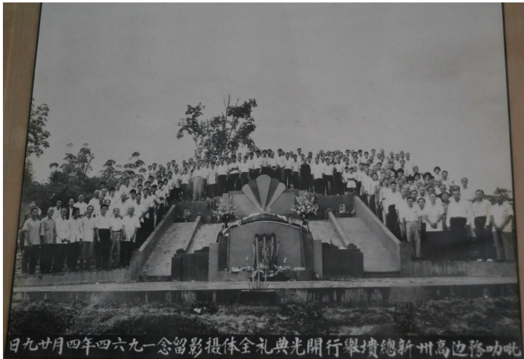
图十二：新高州总坟