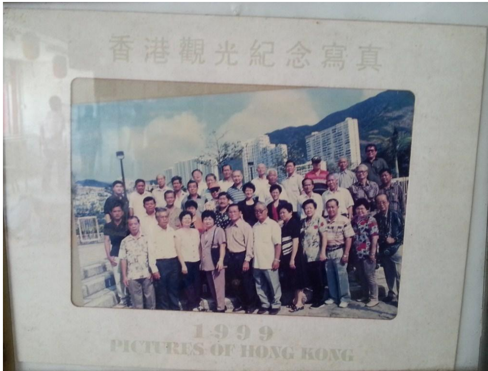
图七：1999年组团出国旅游