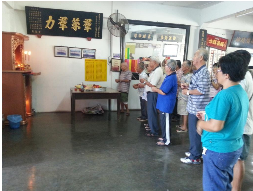
图十三：祭拜冼太夫人