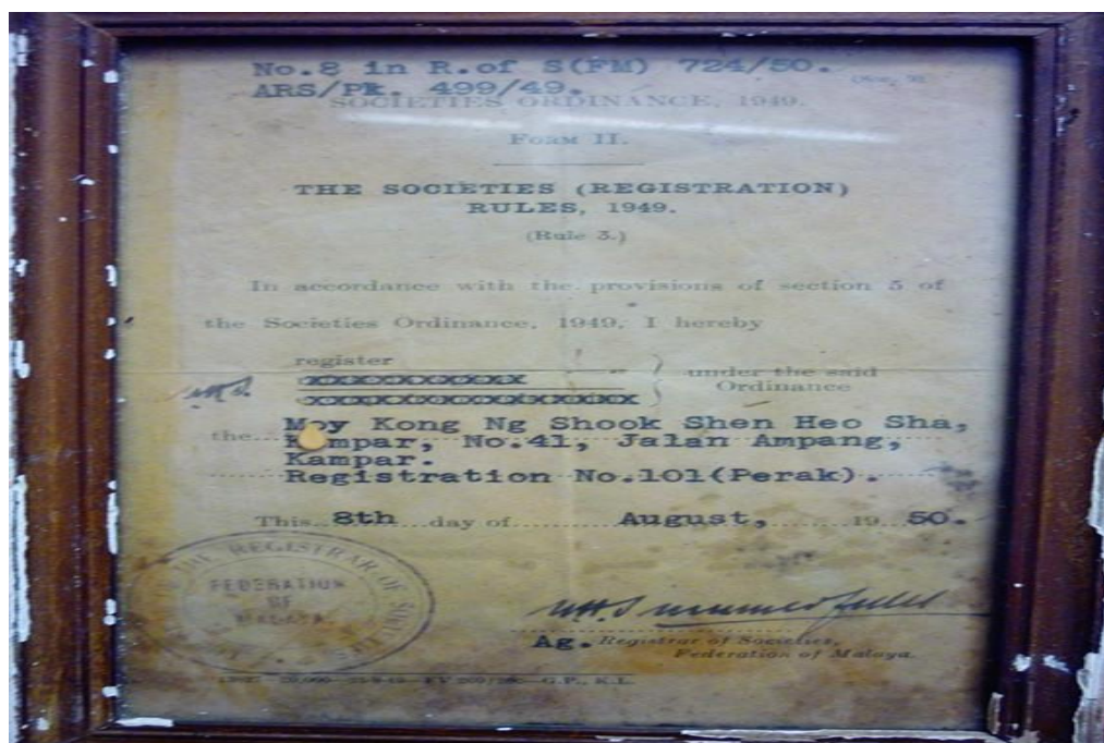
【图三】梅江五属善后社注册法令