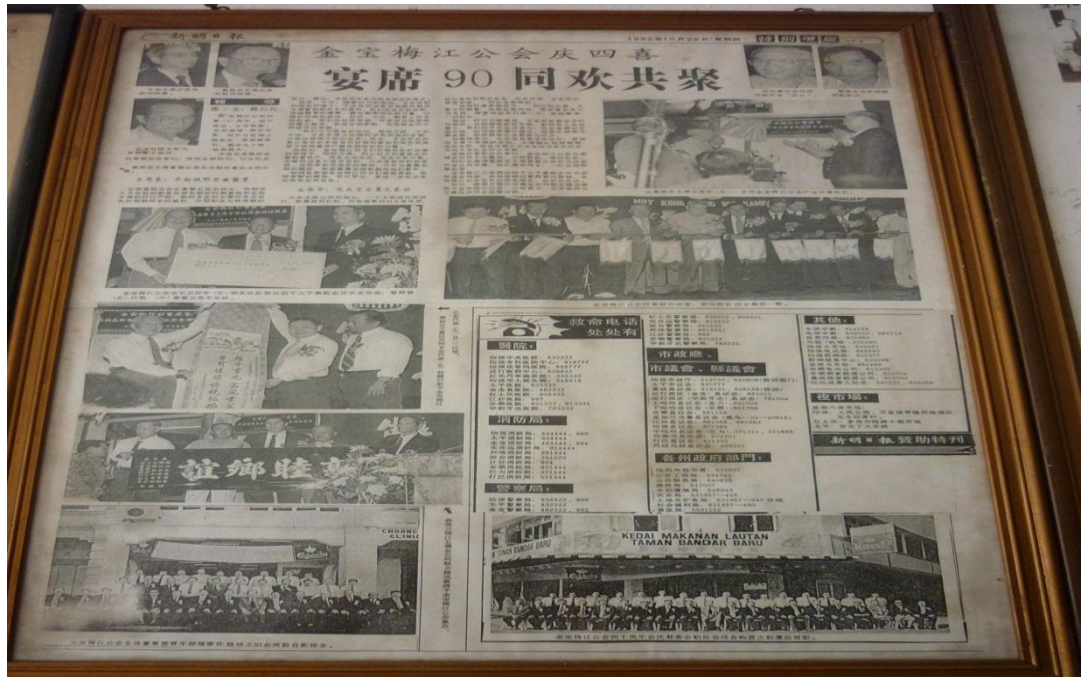
【图九】金寶梅江公會 1992 年會慶四喜