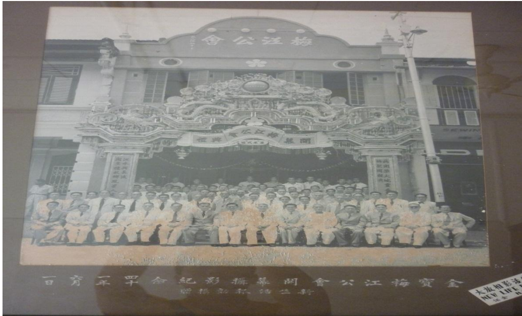
【图五】金宝梅江公会开幕摄影纪念-民国四十一年六月一日（1952年）