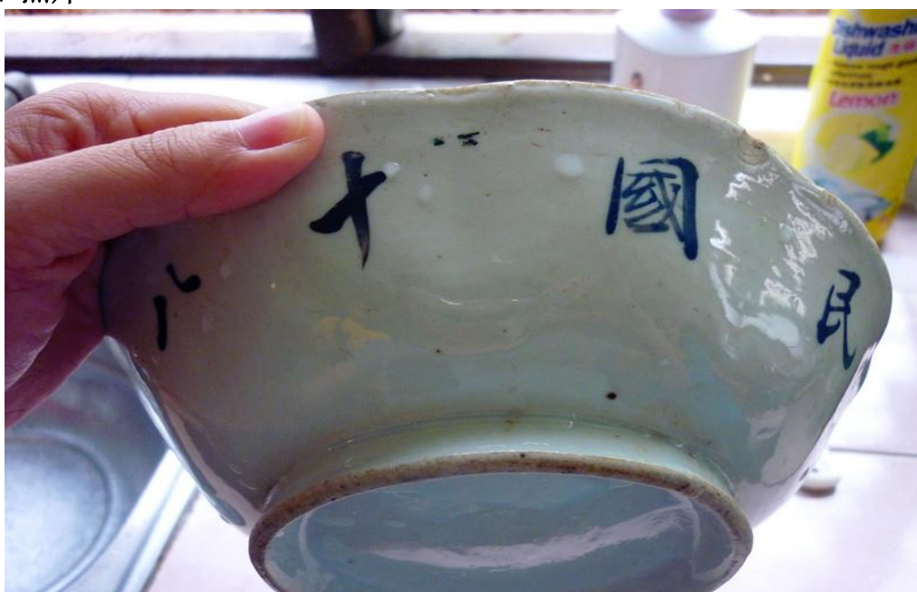
【图一】印有民国十八年（1929年）嘉应五属之碗