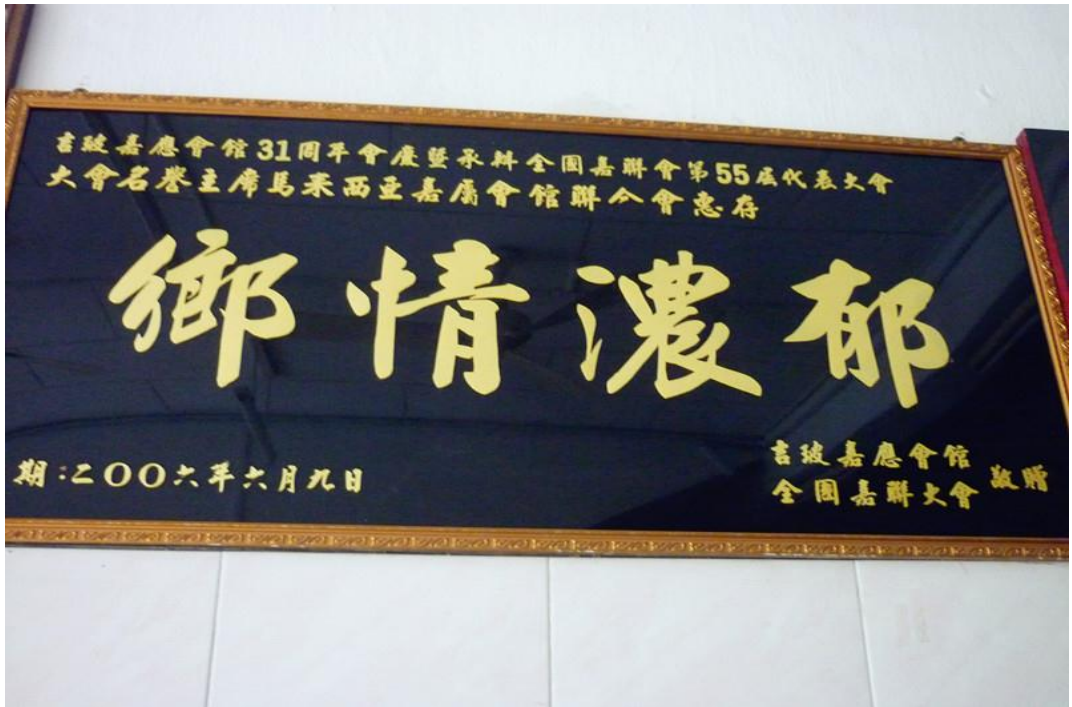
【图十二】乡情浓郁牌匾