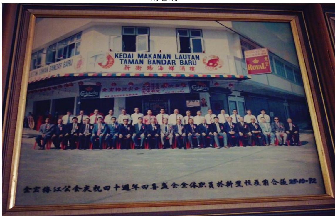
【图八】金寶梅江公會慶祝四十週年（1992年）四喜盛會全體職員於新置恆產前合攝