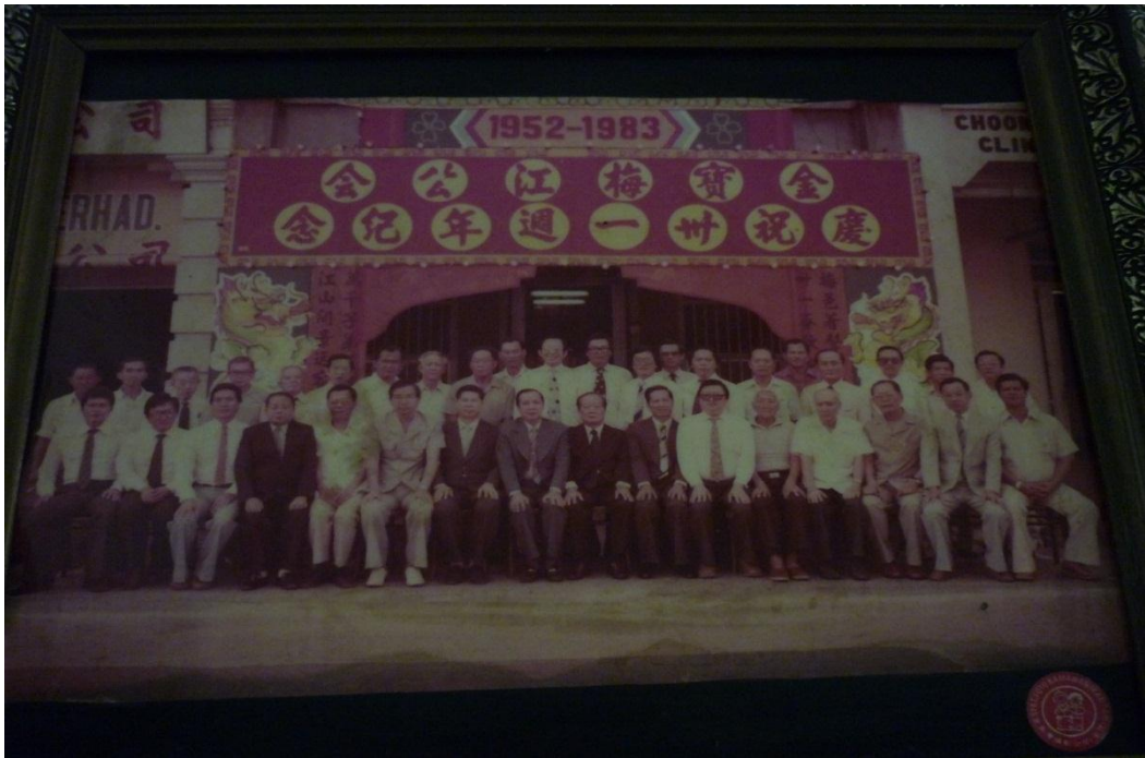
【图六】金宝梅江公会庆祝三十一周年（1983年）纪念