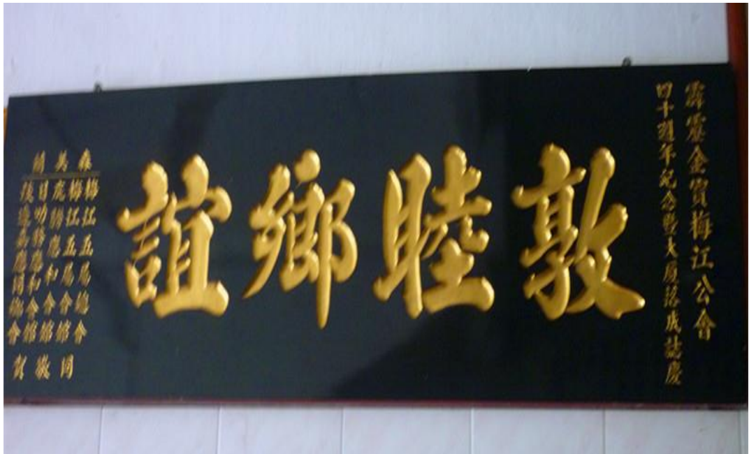
【图十一】敦睦乡谊牌匾