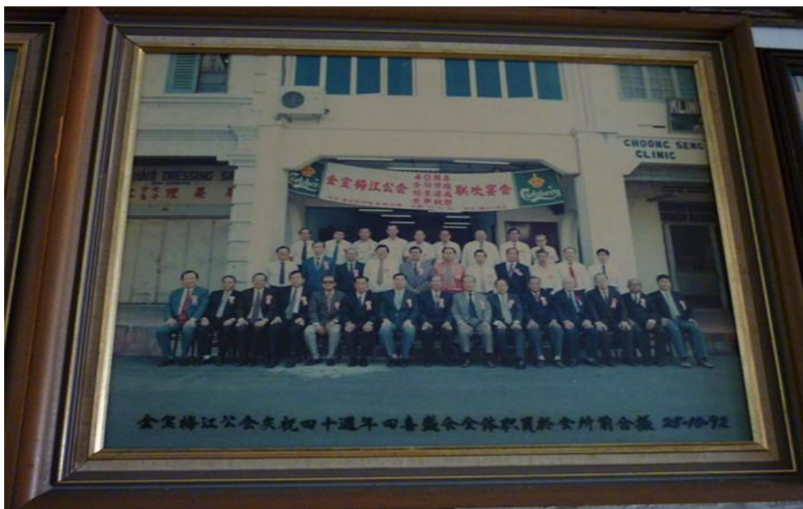
【图七】金寶梅江公會慶祝四十週年（1992年）四喜盛會全體職員於金寶會所前合攝