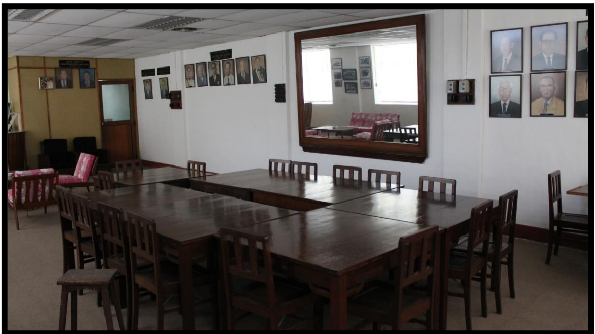
图二：霹靂華人礦務公會會議室