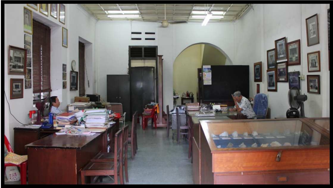
图三：公会前方办事处分租于合兴公司