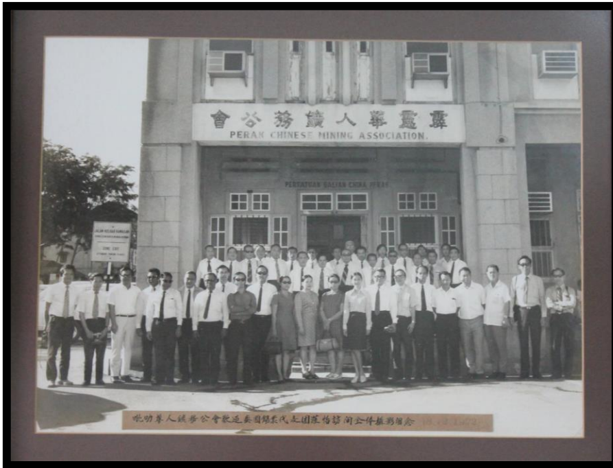
图七：1972年12月18日泰国锡业代表团造访霹雳华人矿务公会