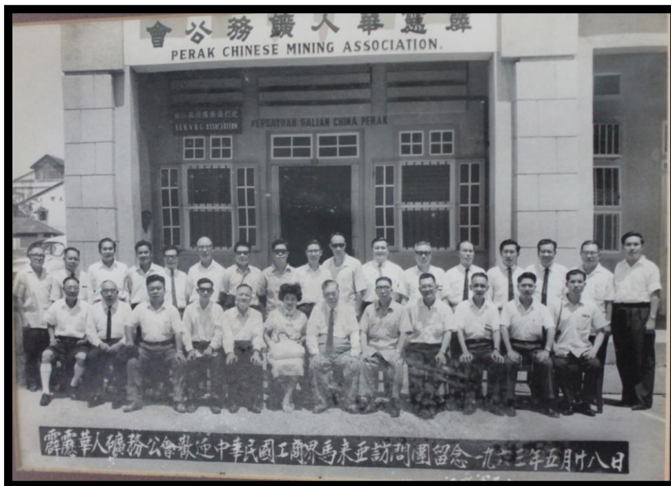
图六：1963年5月28日中华民国工商界马来亚访问团造访霹靂華人礦務公會