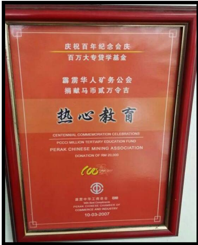
图十一：霹雳华人矿务总会捐赠两万令吉于“百万大专贷学基金”