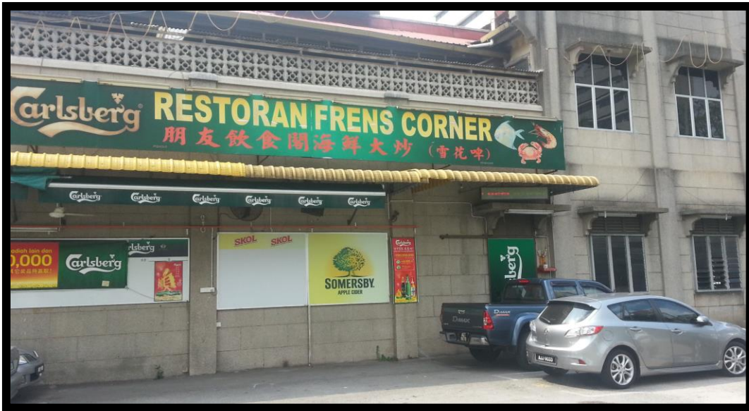
图四：公会后方分租于朋友饮食阁