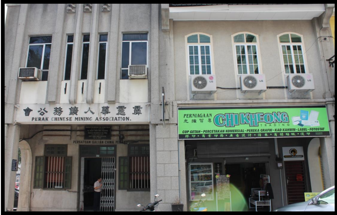
图一：霹靂華人礦務公會會所及志强貿易