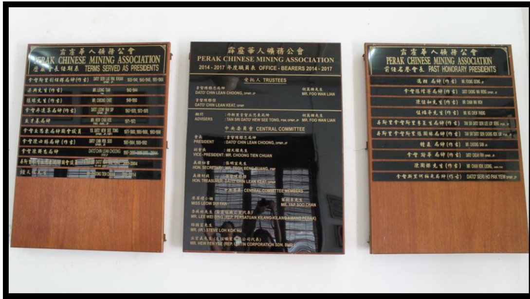
图九：霹靂華人礦務公會中委會、歷代會長及歷任名于會長名牌表