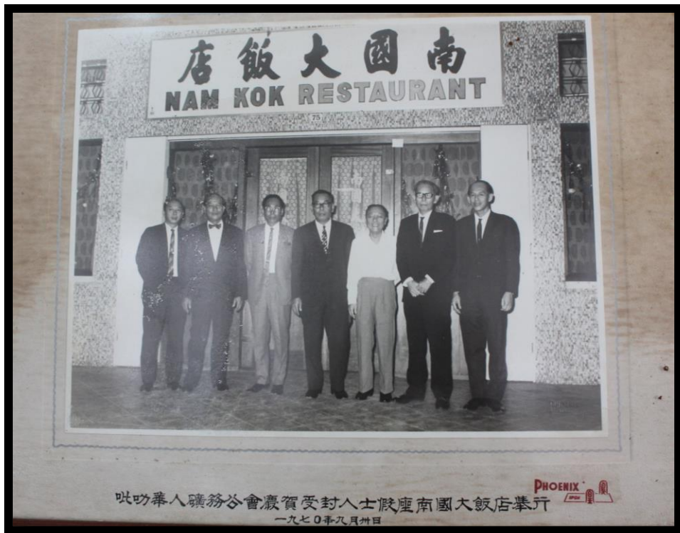
图五：1970年于南国大饭店举行会员受封晚宴