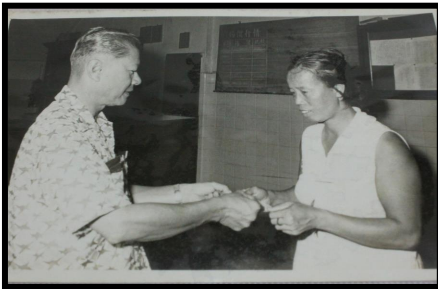
图八：霹雳华人矿务公会颁发体恤金给矿工家属