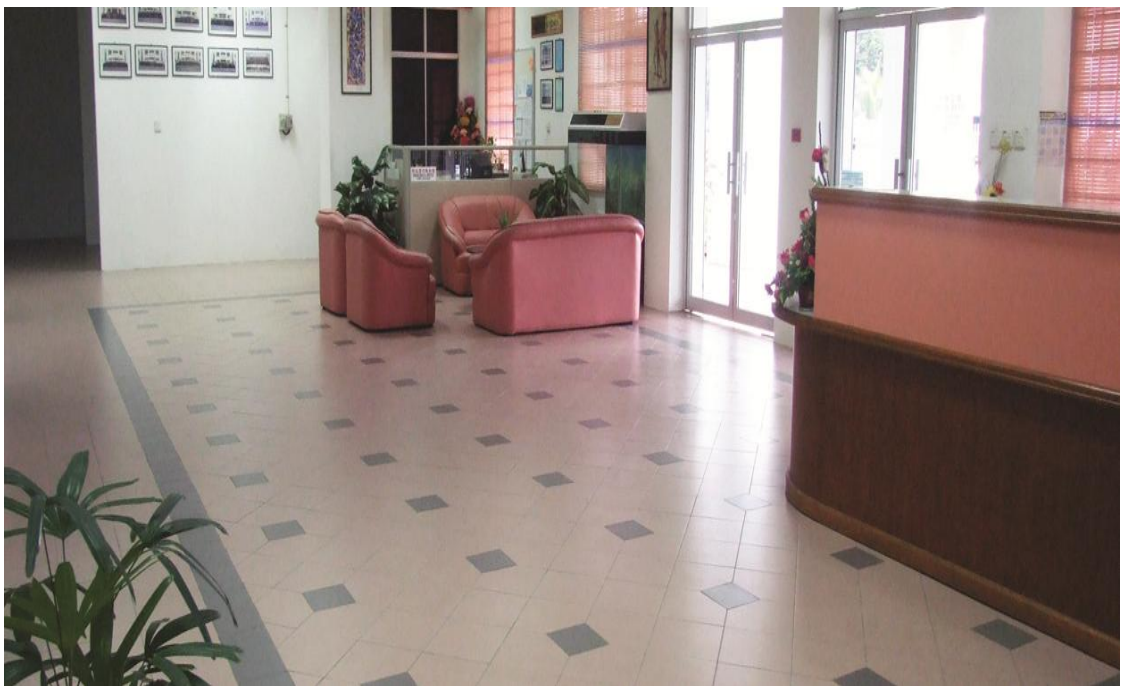
图十九：办公室大厅