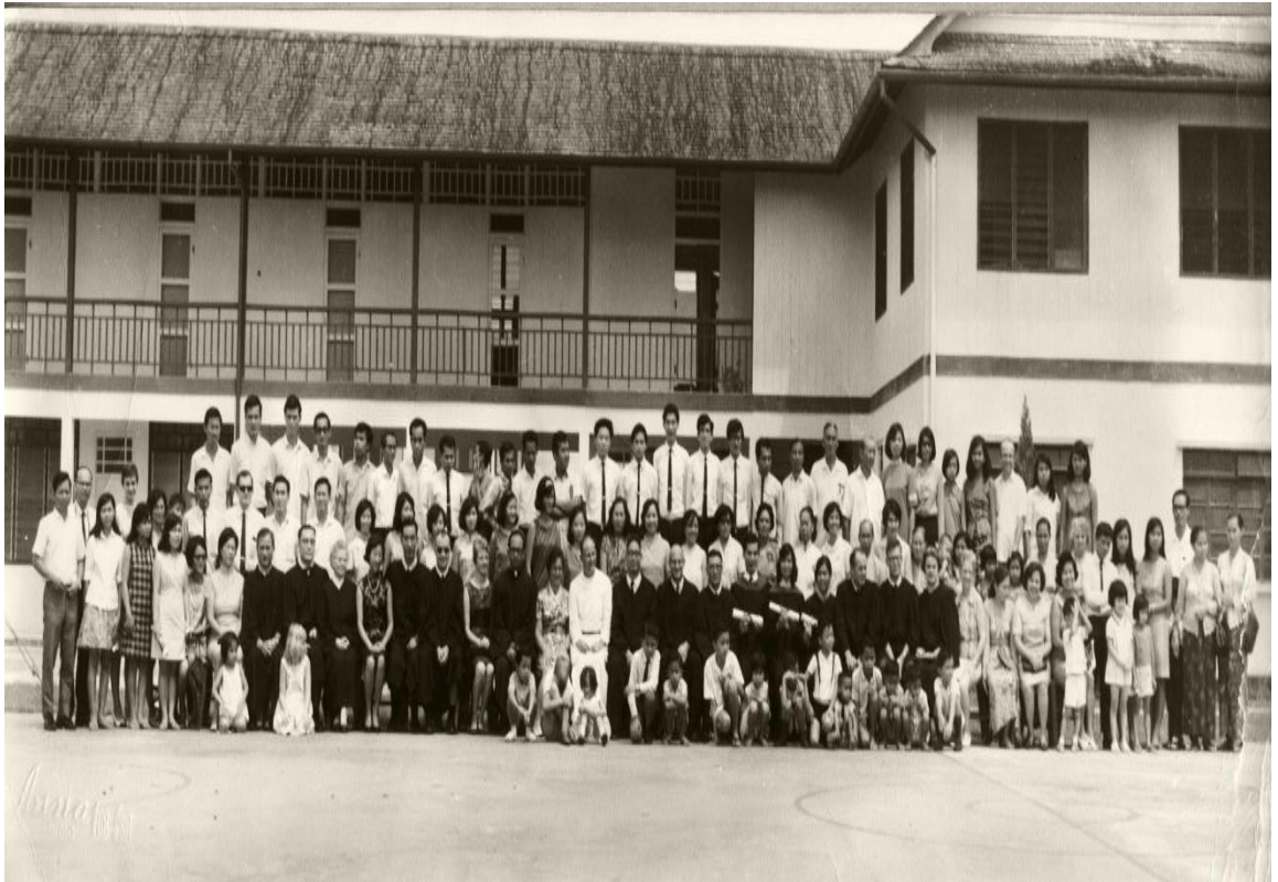
图七：1970年代的毕业生、讲师、董事部成员、教会领袖与会友