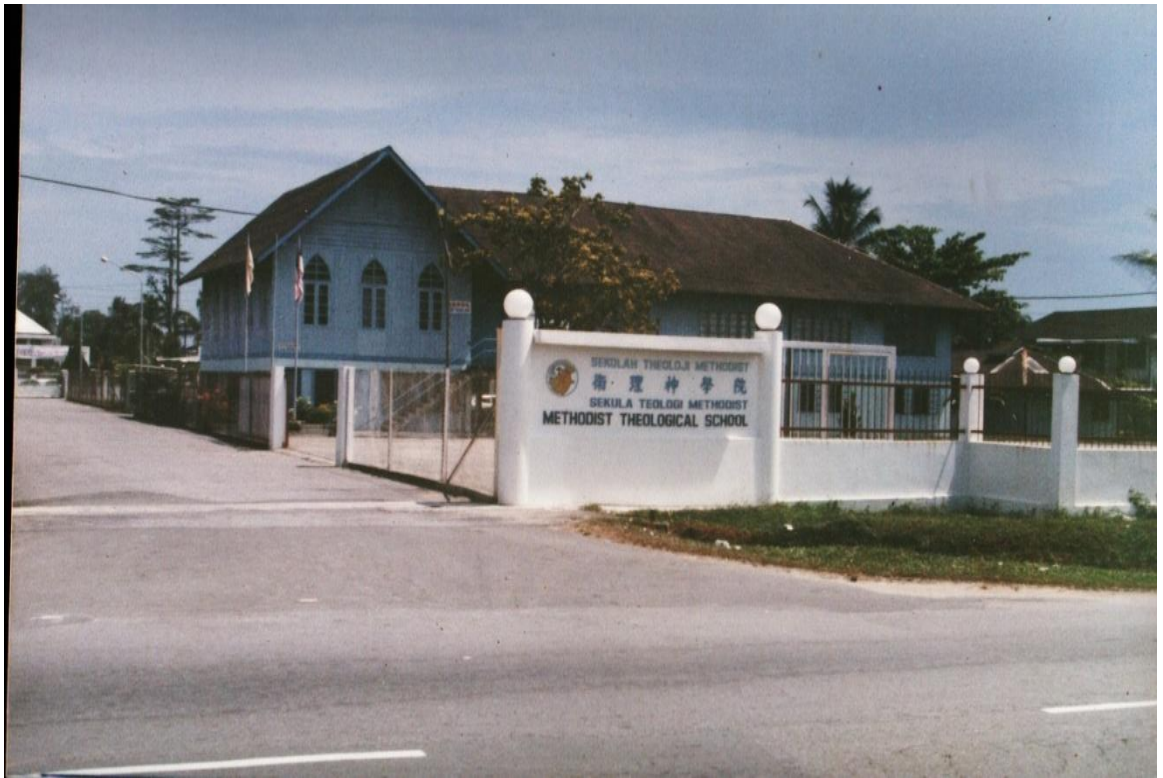
图九：1993年摄于卫神入口处