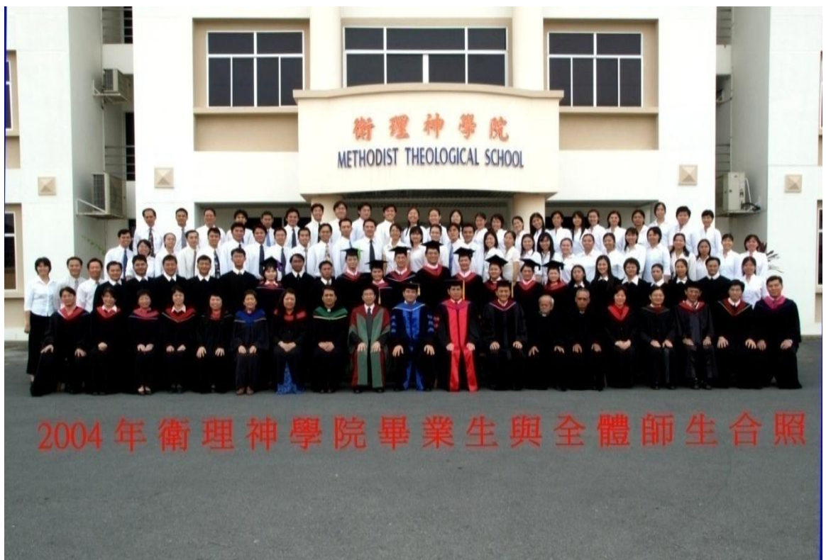
图三十五：2004年毕业生与导师及神学院职员