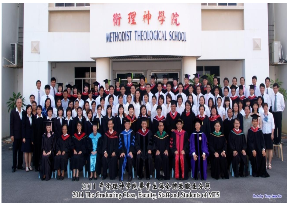
图四十二：2011 年毕业生与导师及神学院职员