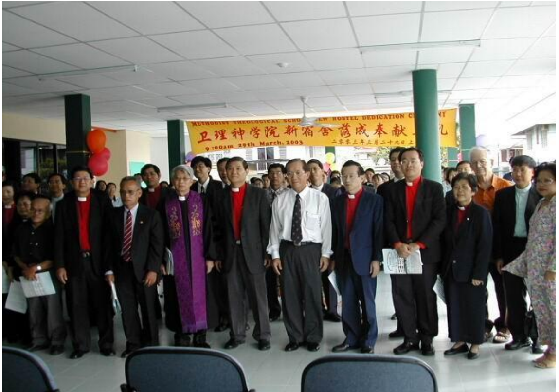
图十三：2003年3月29日四层楼女生与讲师宿舍落成奉献典礼并命名为苏珊娜楼