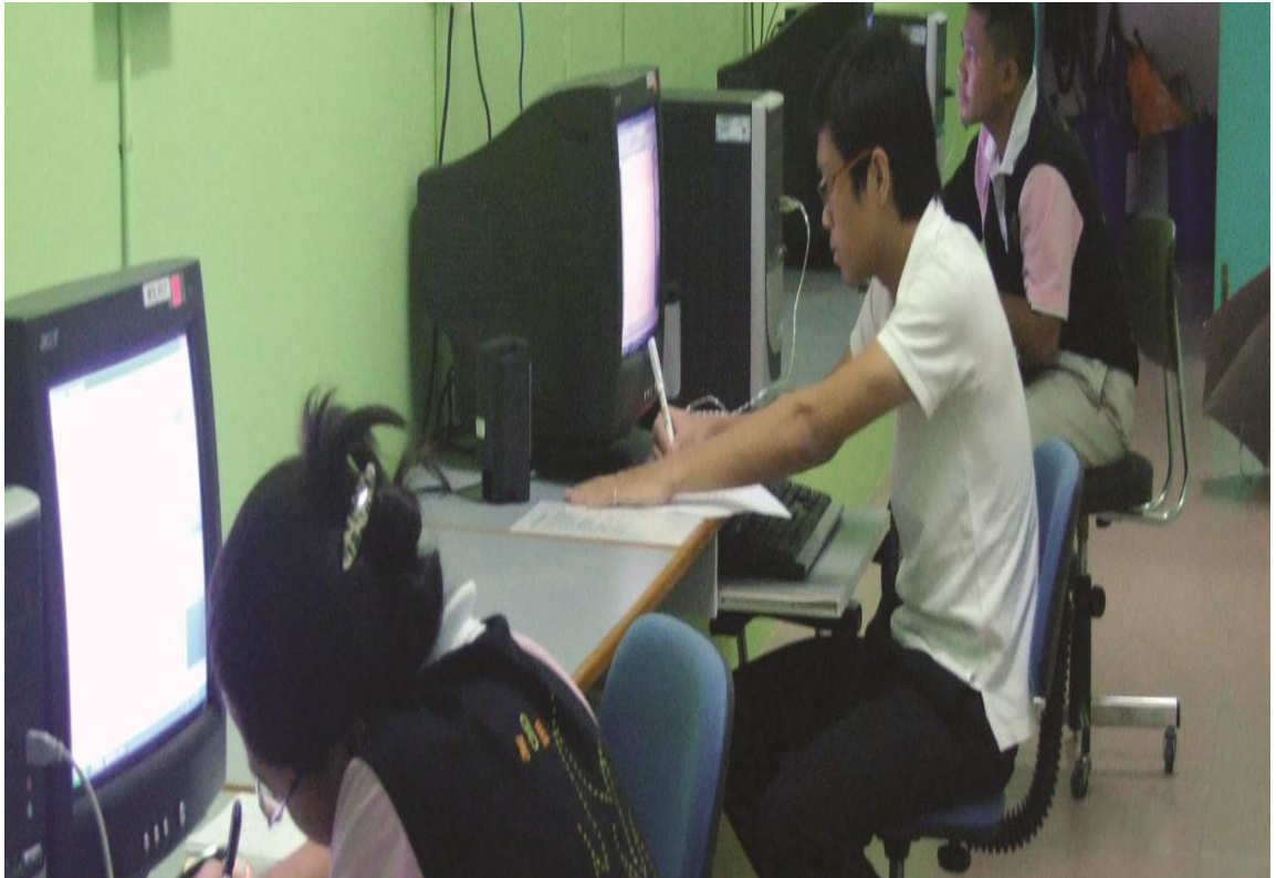
图二十四：电脑角落