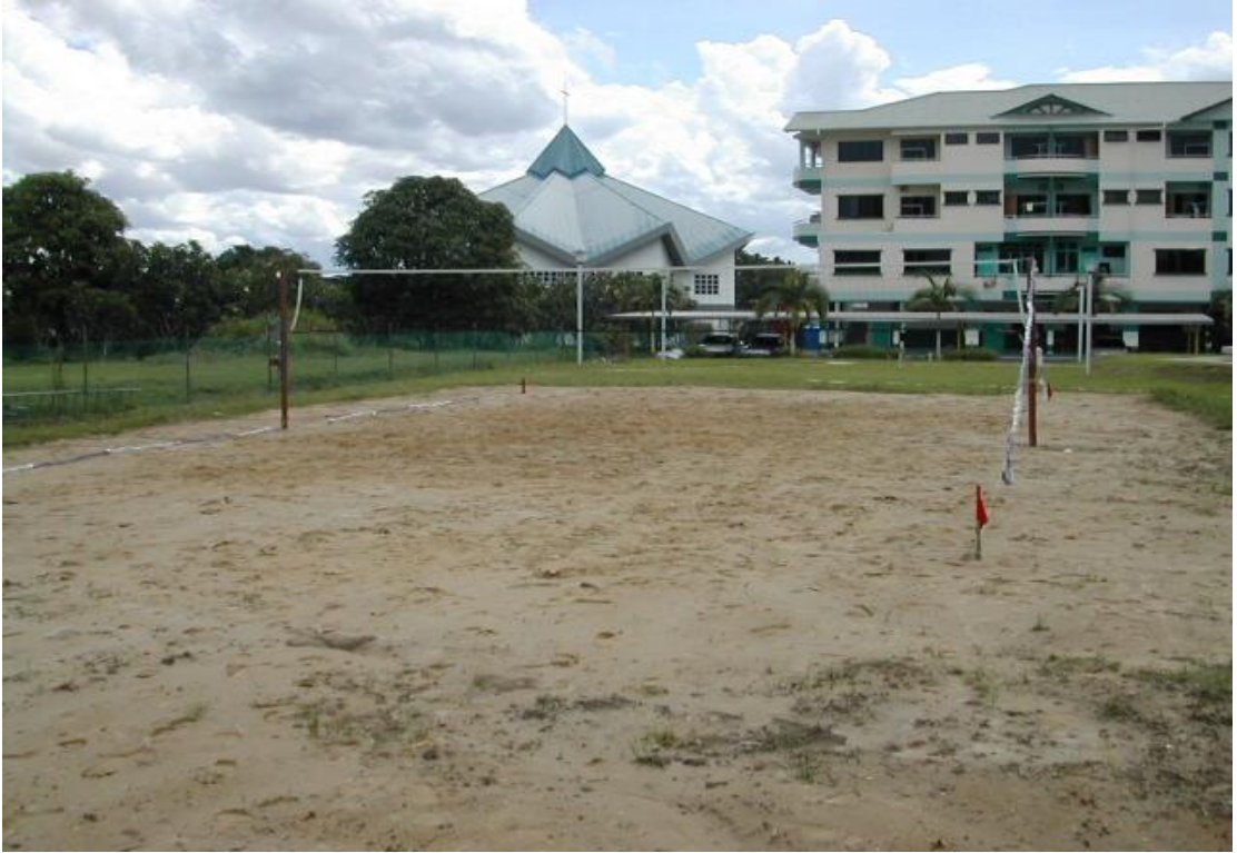
图十七：已于 2009 年 3 月 30 日被撤除的沙滩排球场（建于 2005 年）