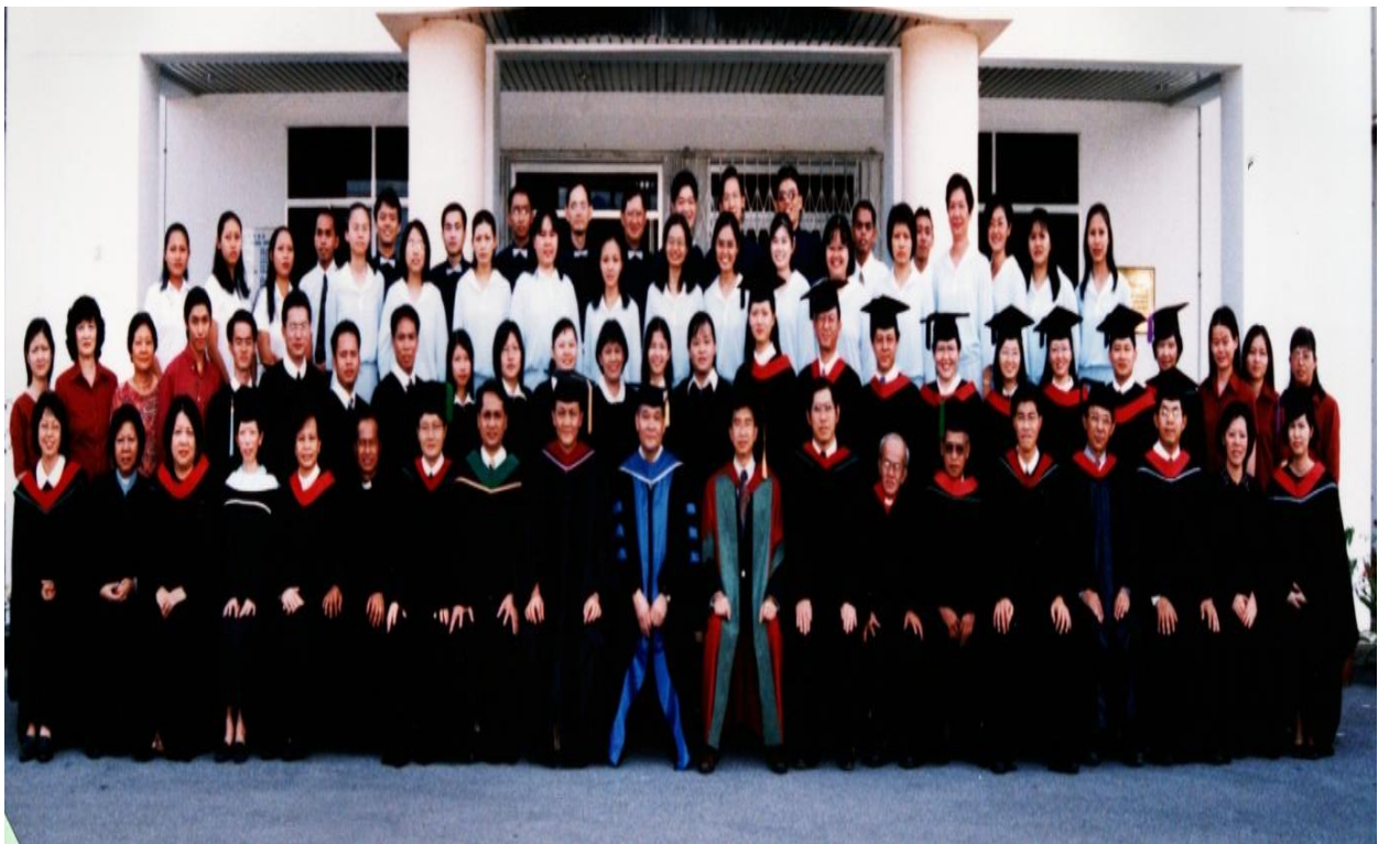
图三十三：2002年毕业生与导师及神学院职员