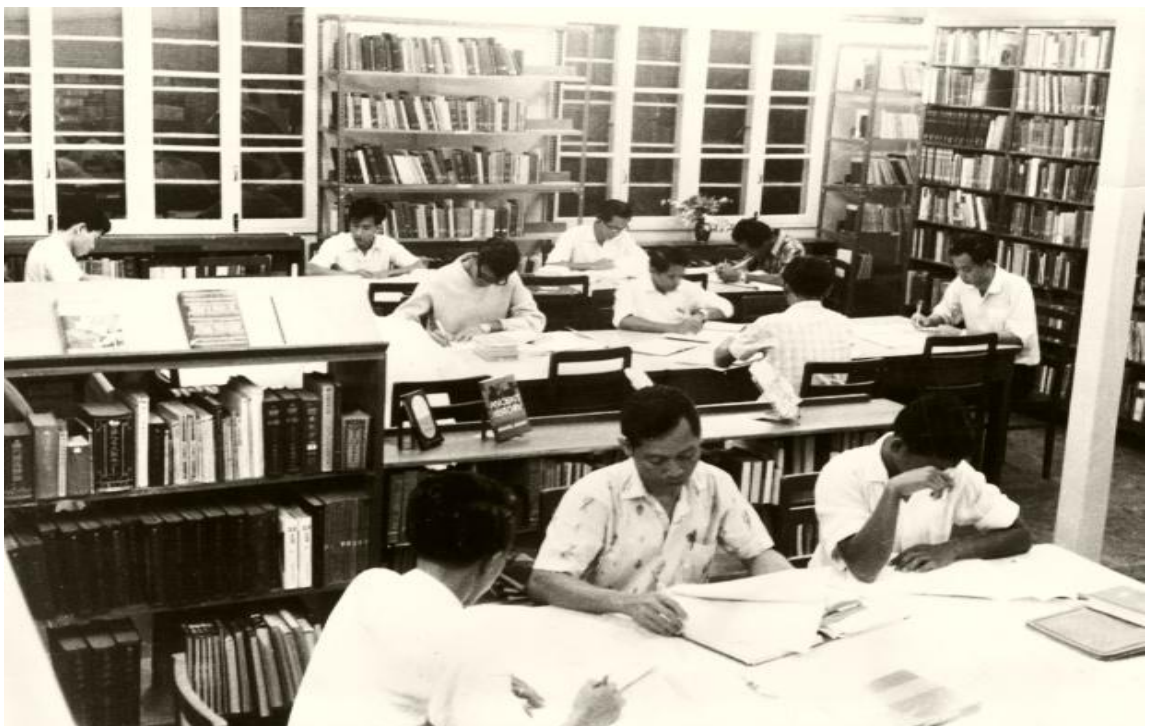
图四：1960年代的卫神图书馆