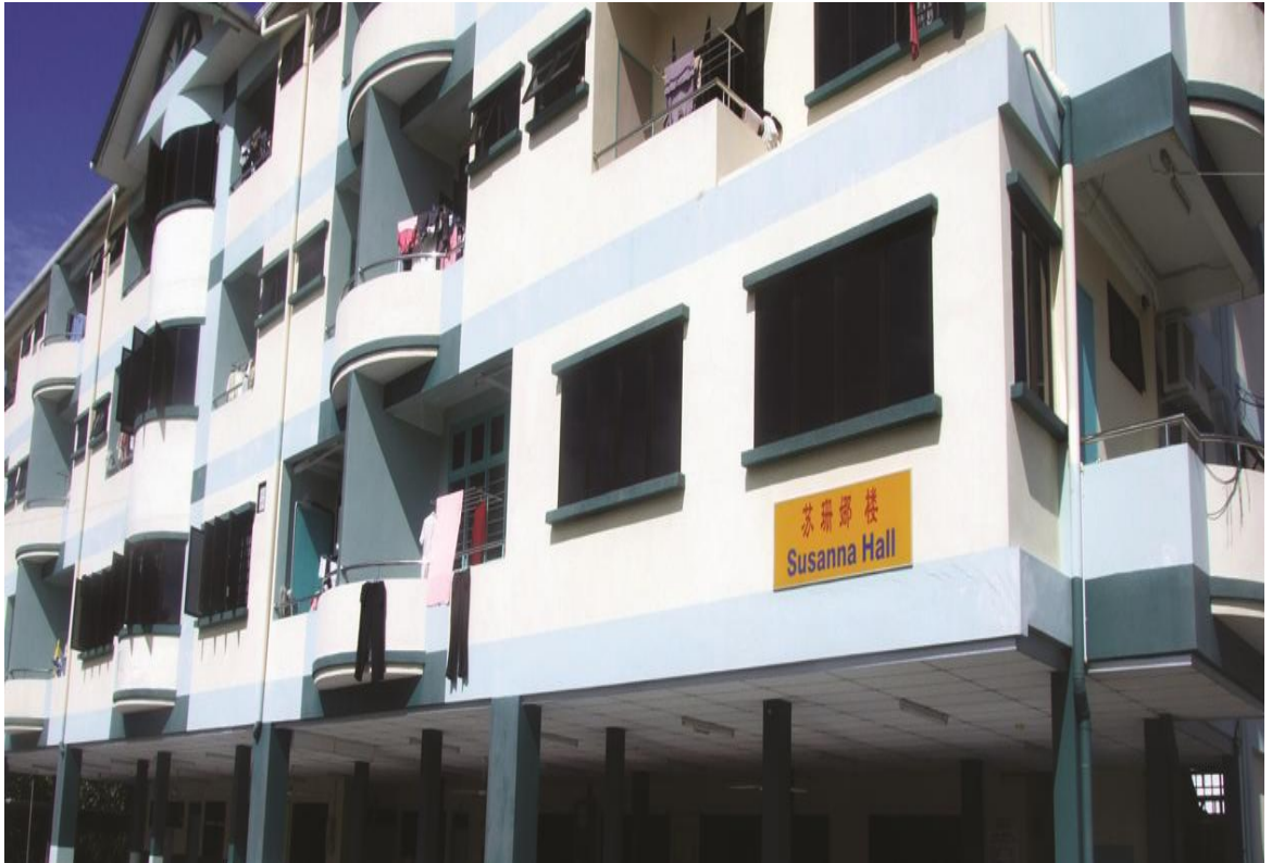
图二十六：女生宿舍-苏珊娜楼