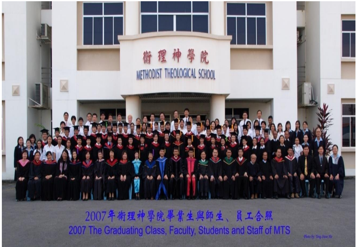
图三十八：2007年毕业生与导师还有神学院职员