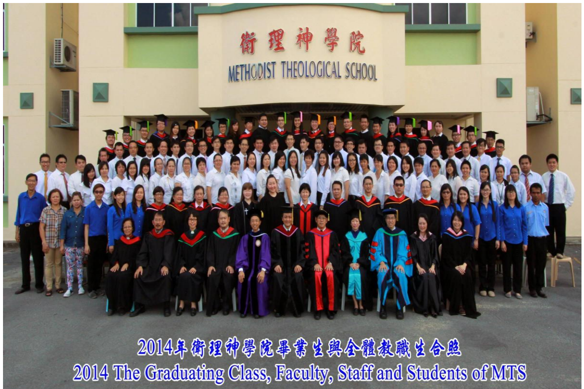
图四十五：2014 年毕业生与导师及神学院职员