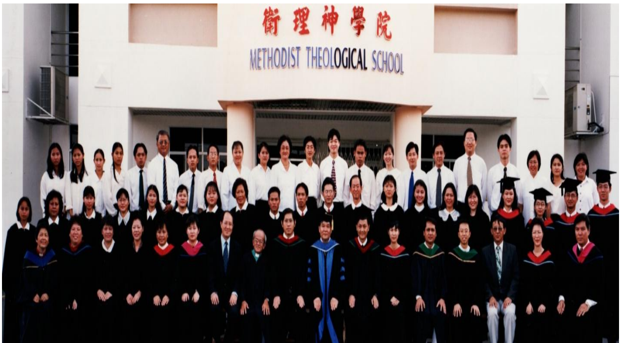
图三十一：2000年毕业生与导师及神学院职员