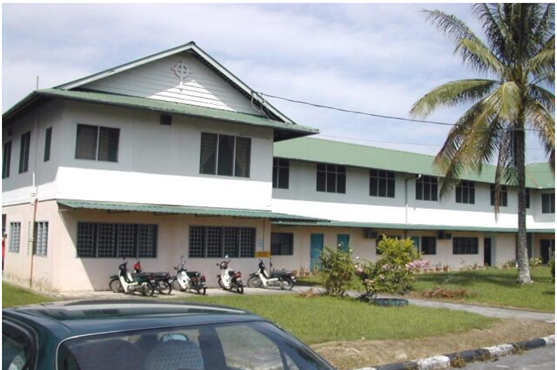
图十六：1959年所建的女生宿舍装修后改为男生宿舍，命名为查尔斯卫斯理楼（现已拆除）