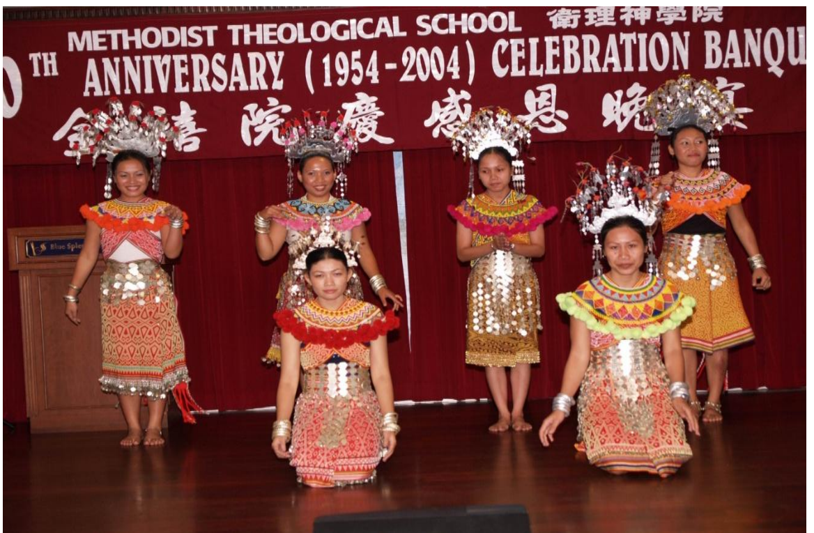
图十四：2004年伊班学生于卫神庆祝五十周年晚宴上呈献舞蹈