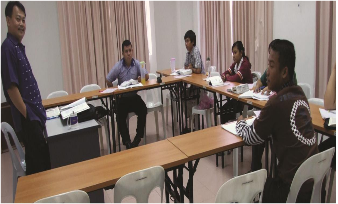
图二十：学生上课时摄