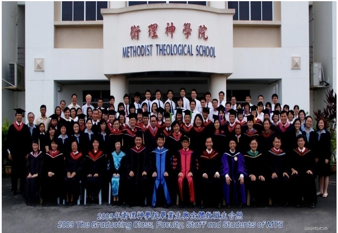
图四十：2009年毕业生与导师及神学院职员