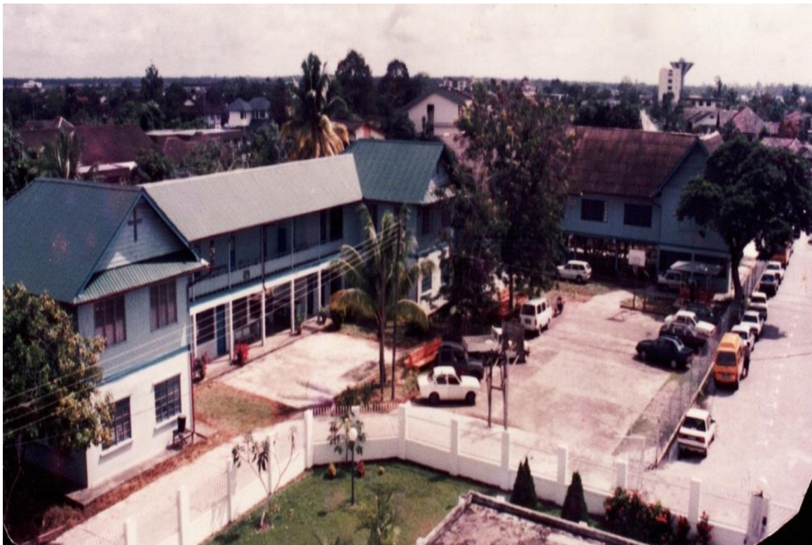
图八：1990年卫神校舍全景