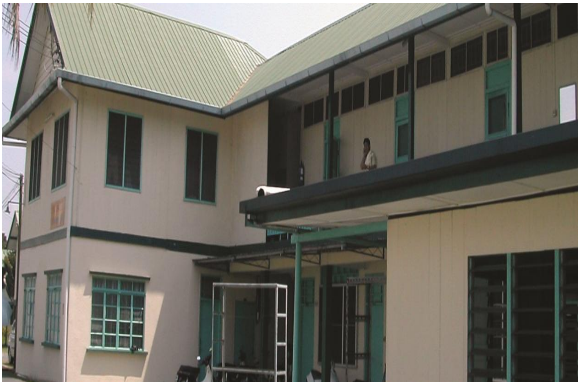
图二十七：男生与讲师宿舍-查尔斯卫斯理楼