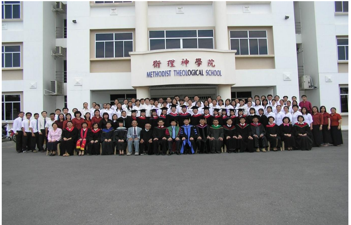
图三十四：2003年毕业生与导师及神学院职员