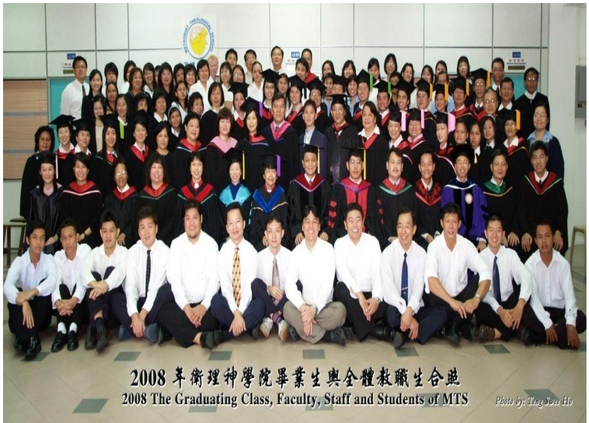
图三十九：2008年毕业生与导师及神学院职员