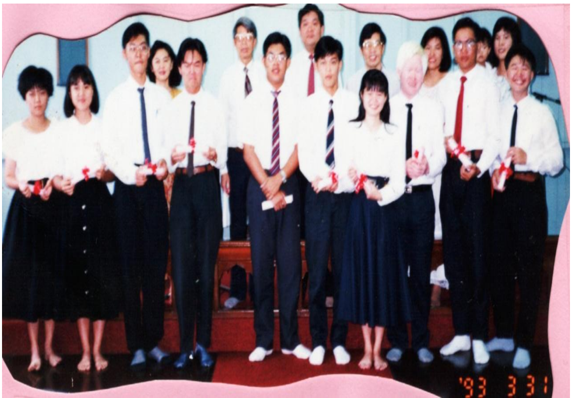
图十：1993年第一届卫神华文部短期宣教学校学员结业礼