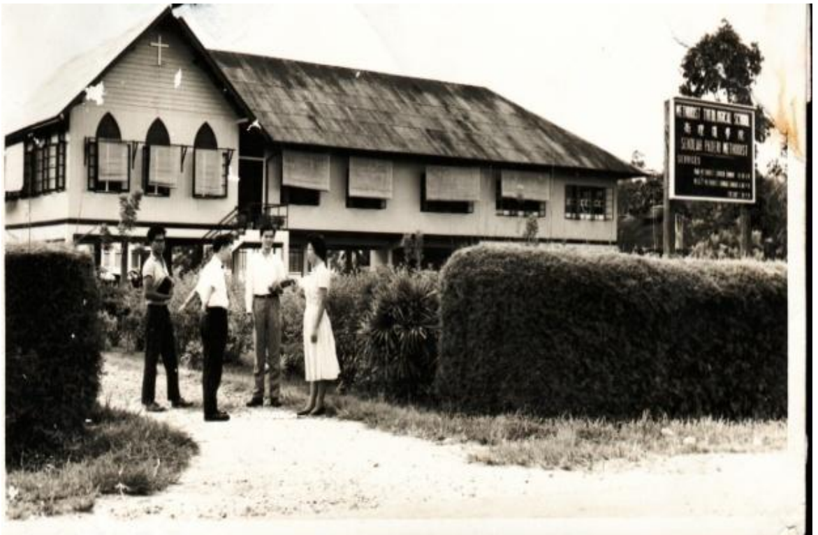
图六：1965年摄于卫神入口处