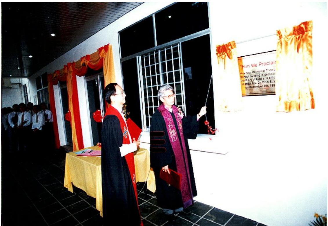
图十二：1998年12月7日卫神四层新的行政楼落成典礼