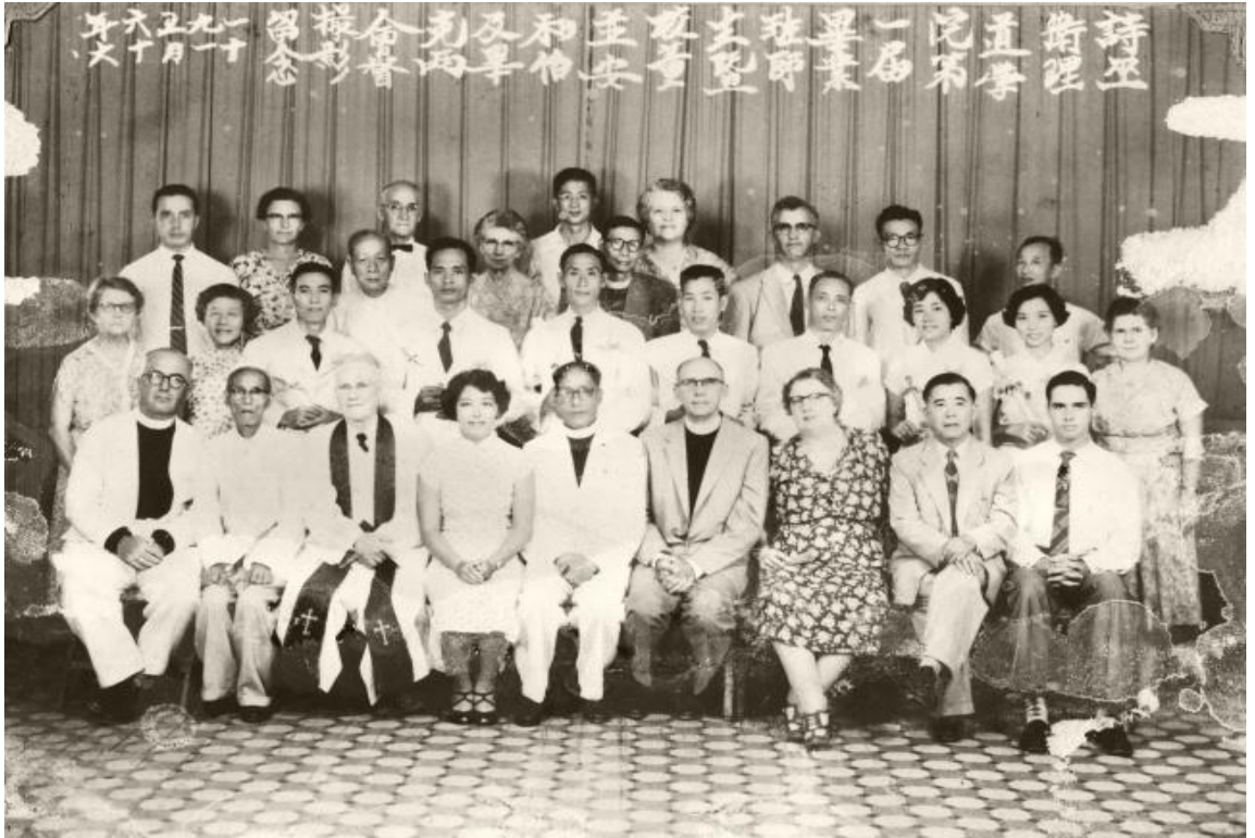
图三：1956年11月16日会督、董事、讲师与卫神第一届毕业生合照