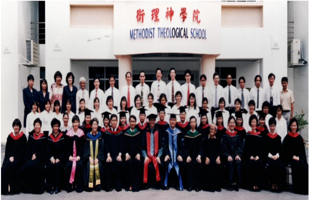
图三十：1999年毕业生与导师及神学院职员