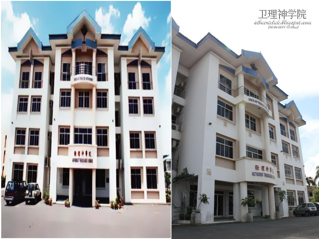
图十八：卫神行政楼外观