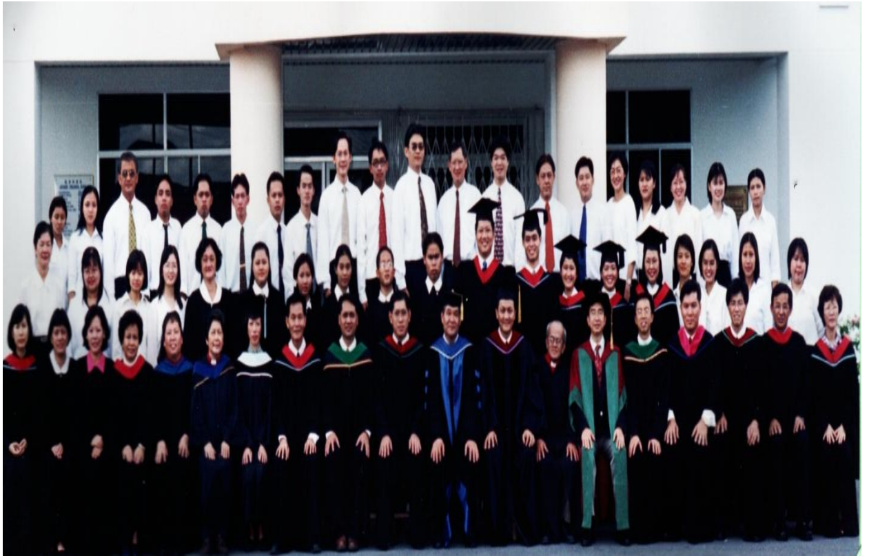
图三十二：2001年毕业生与导师及神学院职员