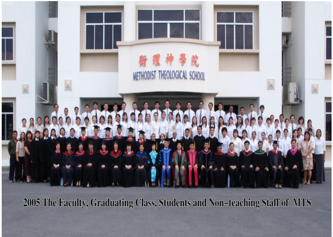
2005 The Faculty, Graduating Class, Students and Non-teaching Staff of MTS