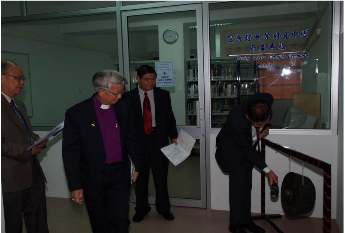
图十五：2004年卫神正式推动卫斯理研究中心