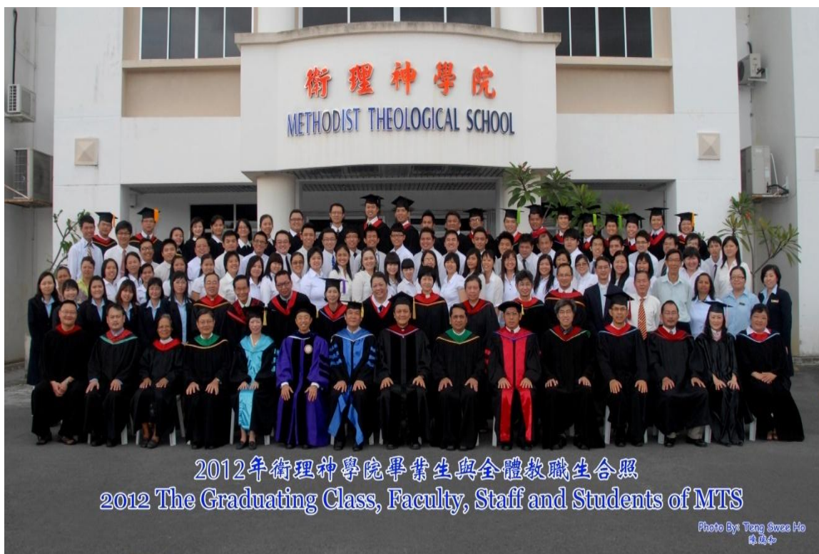
图四十三：2012 年毕业生与导师及神学院职员