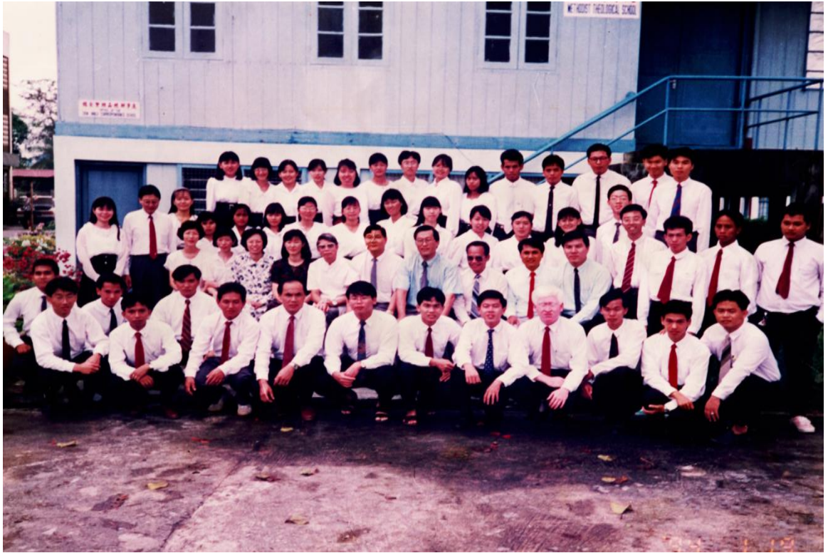
图十一：1994年卫神全家福