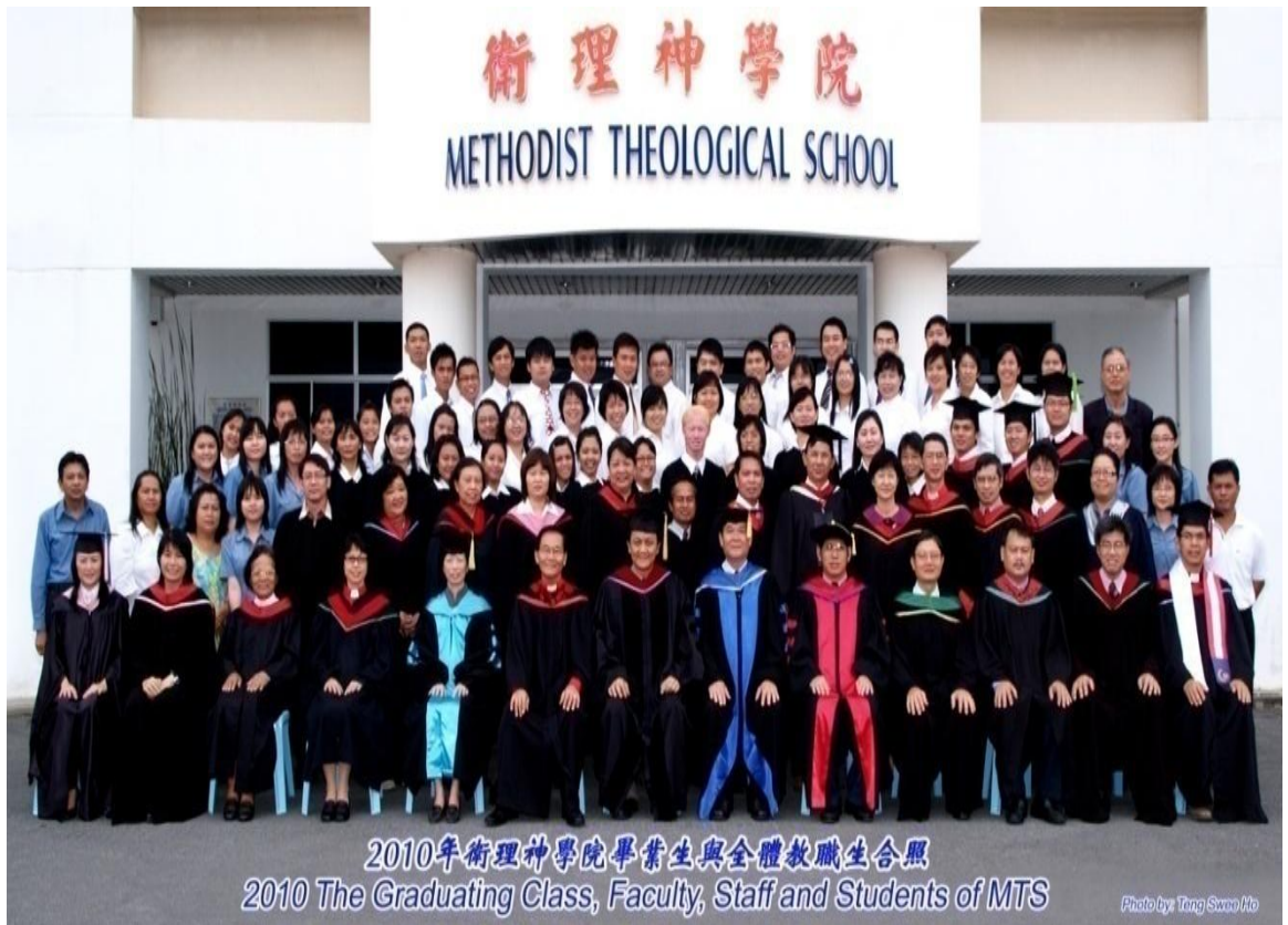
图四十一：2010年毕业生与导师及神学院职员