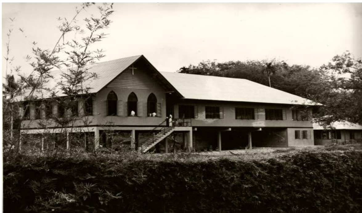
图二：1956年卫神新校舍