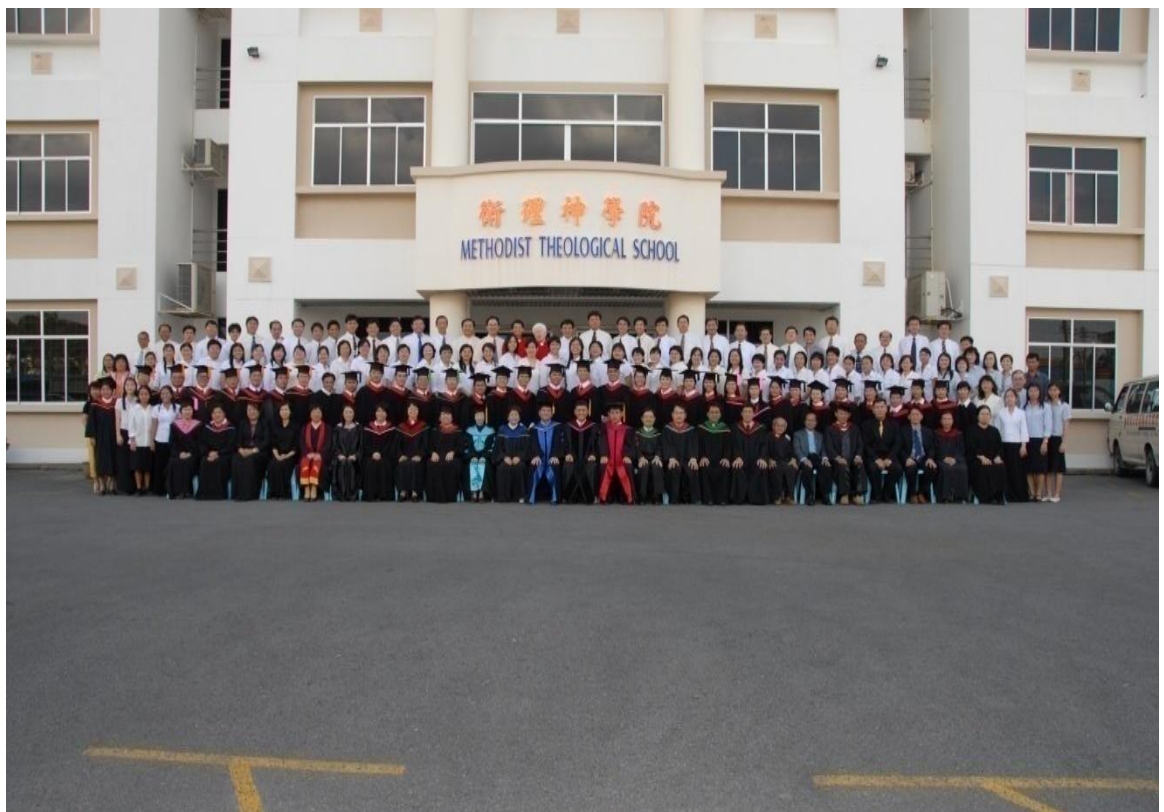
图三十七：2006年毕业生与导师及神学院职员