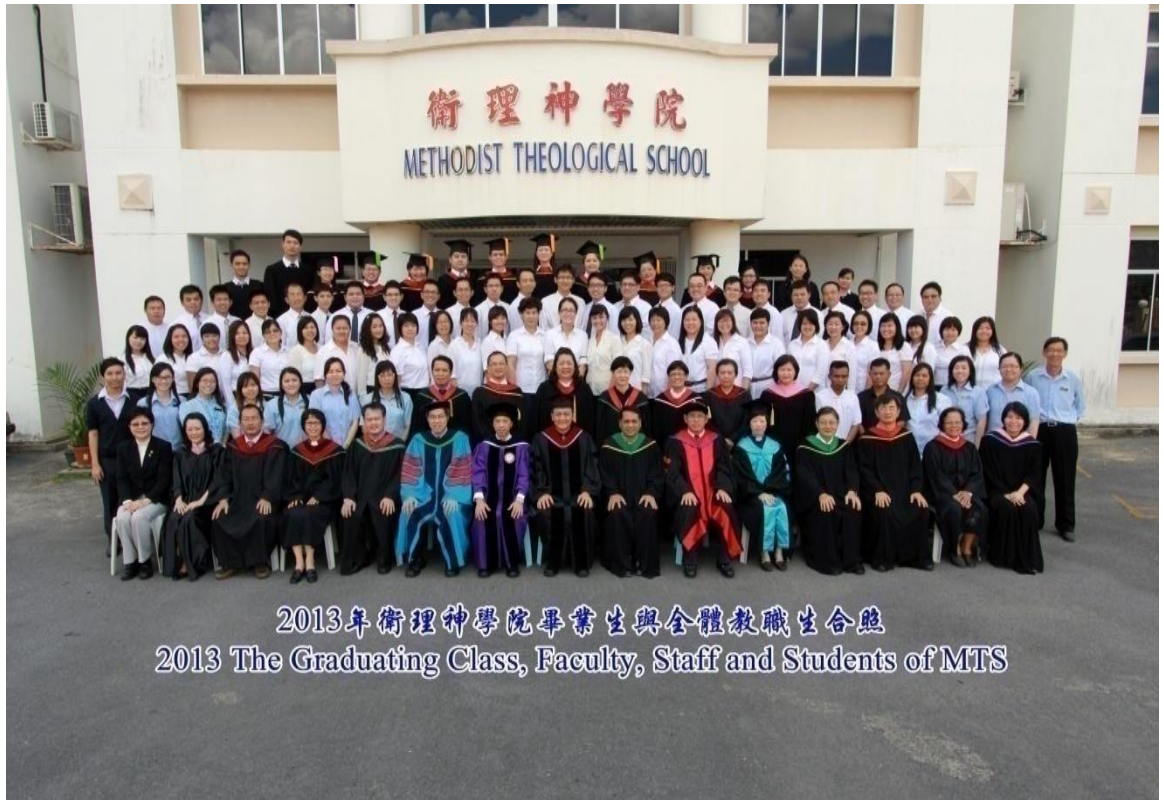
图四十四：2013 年毕业生与导师及神学院职员