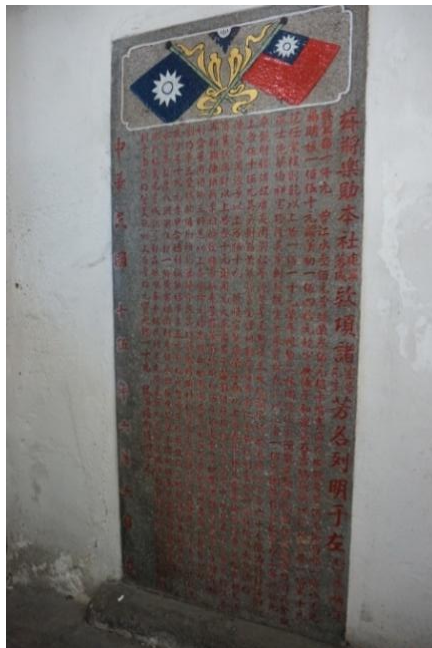
图四：立于 1926 年的石碑记载着捐助益群书报社建筑的赞助人名字

1920 年益群书报社发生火患，使用 10 年的会所付之一炬。当时益群书报社社长何国旗在帆加南街门牌 38 号经营“旗昌号”，售卖煤油灯、大光灯与煤油等物品，在其首肯下，益群书报社便暂时将办事处迁移至“旗昌号”楼上。直至 1925 年，在李箕菊、曾江水、曾继荣与赵平阶等先贤等带动下，才搬迁至位于罗加雅街的新会所，该会所一直使用至今。值得一提的是，益群书报社社内尚存一块立于 1926 年 6 月 6 日的石碑，记载了书报社社员与商号捐助建筑会所的征信录，捐款者众多，数额由十元至一千元不等。