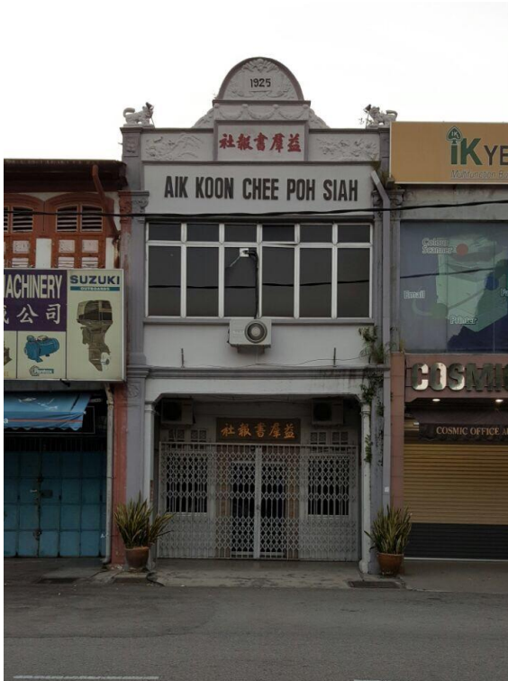
图五：益群书报社的社所从 1925 年使用至今