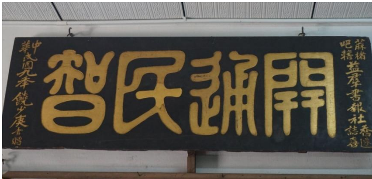
图二：饶少庚于 1910 年赠予益群书报社的“开通民智”匾额

益群书报社成立之初，以开通民智、举行公益为宗旨，属公开组织，大众皆可入社为社员，唯一条件是品行须端正。由于在 1920 年前峇株巴辖的组织并不多，都是业缘、地缘、血缘宗亲组织 6 ，尚无综合型组织，益群书报社的存在则突破了当时组织性质的藩篱，在团结峇株社区民众方面起了显著作用。当时书报社正大力推展“识字运动”，社内置放各种书籍与新闻日报以供大众阅读，各界人士只要是宗旨纯正，既可到社内演讲，借着举办这些活动以扫除文盲，启迪民智。