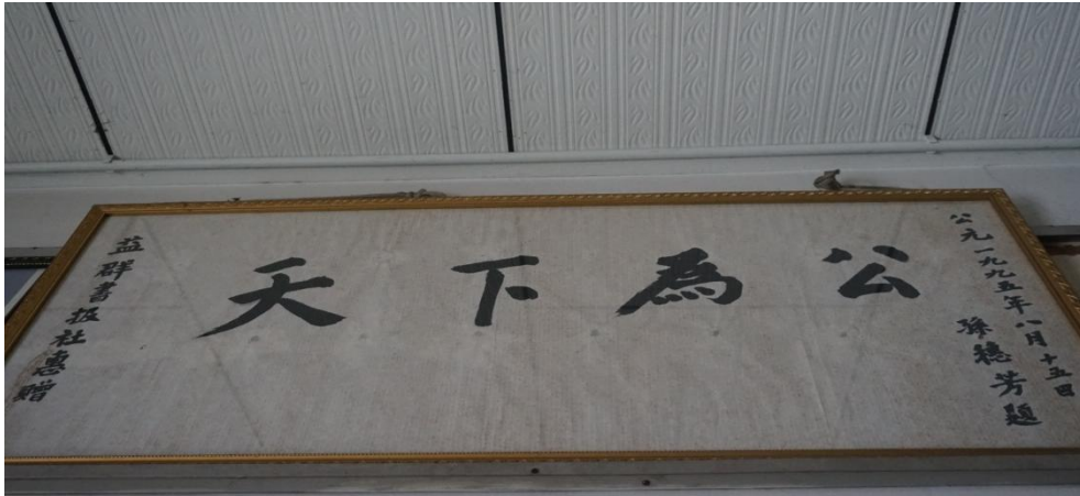
照片来源：2016 年 3 月 8 日摄于益群书报社。