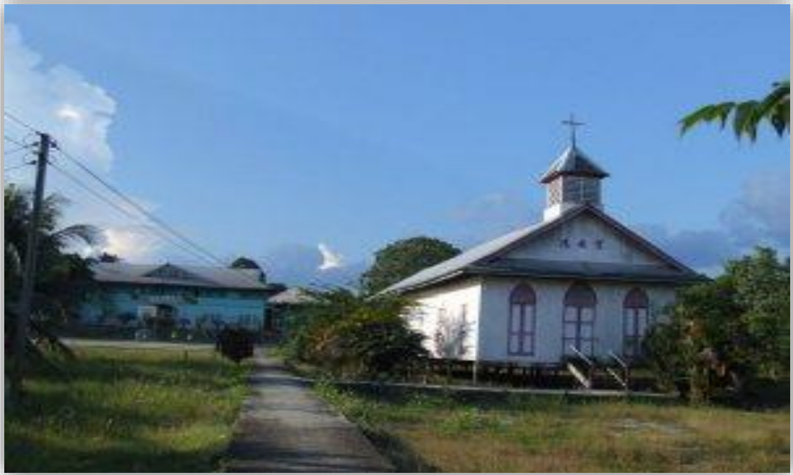
图 1：福安堂正面照（左边建筑为开智学校）