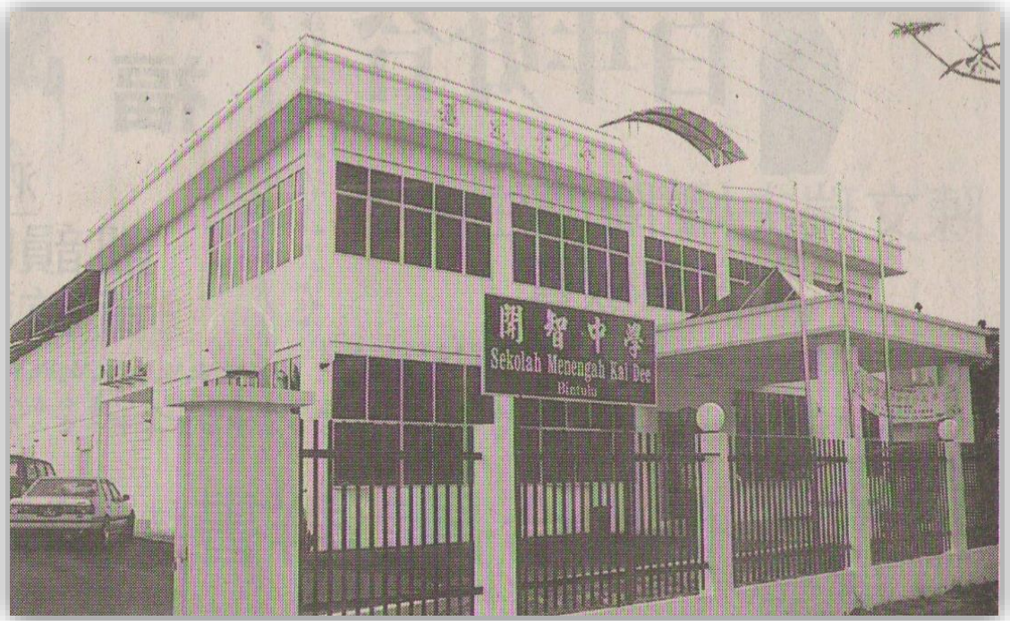
图 13：民都鲁开智中学原定临时校址——民都鲁福建公会会所