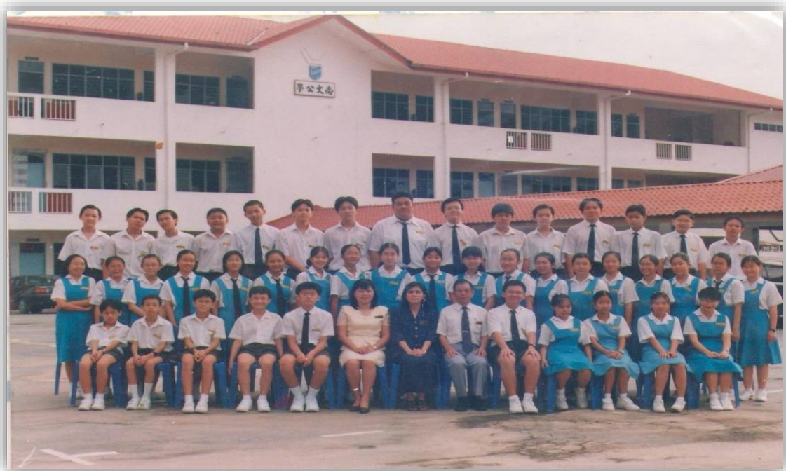
图 16：2001 年开智中学初一生大合照 (后为开智中学临时校址——民都鲁尚文公学第三期新教育楼)