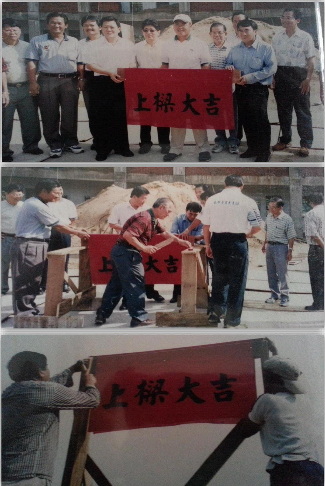
图 19：开智中学上梁仪式