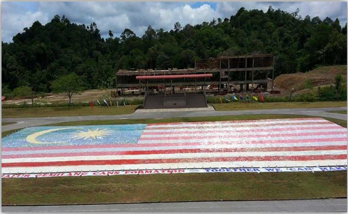
图 24：开智中学制作全马最大铝罐国旗