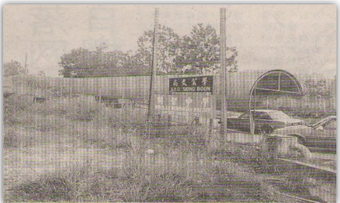
图 14：民都鲁开智中学最终临时校址——民都鲁尚文公学（路口图）