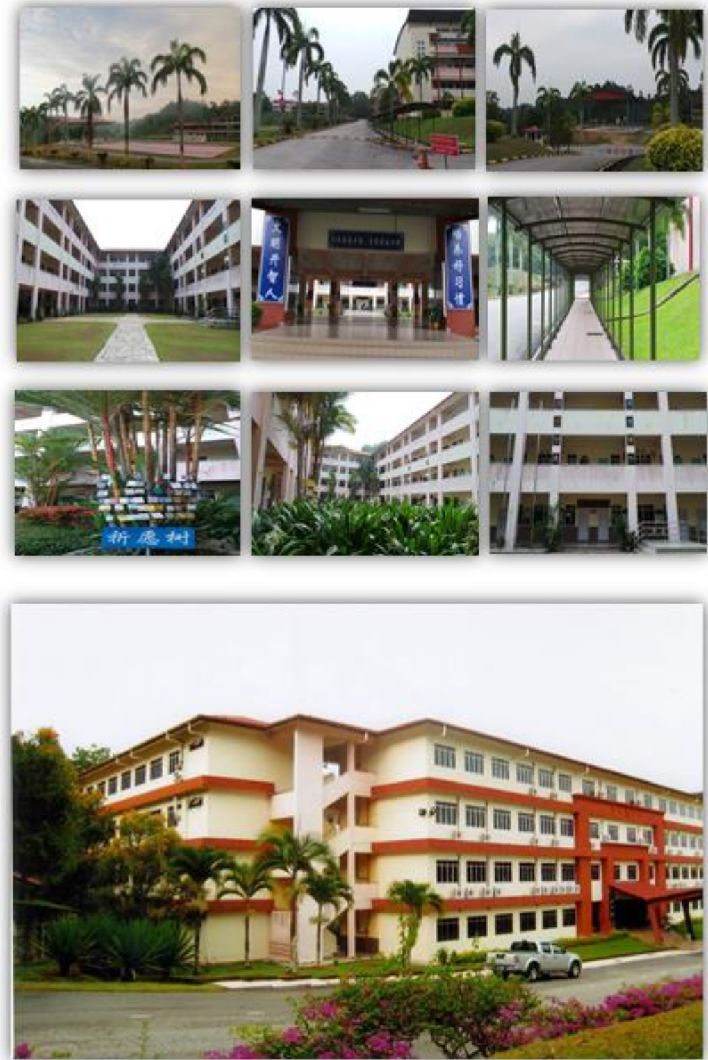
图 20：民都鲁开智中学校景图