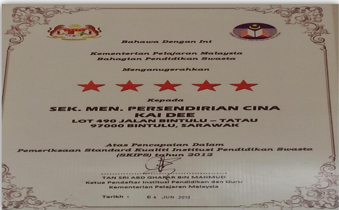
图 25：民都鲁开智中学——五星级卓越学府奖状