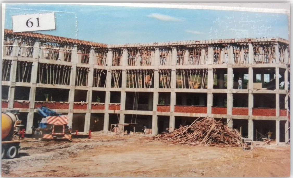
图 11：民都鲁开智中学新校舍建工中