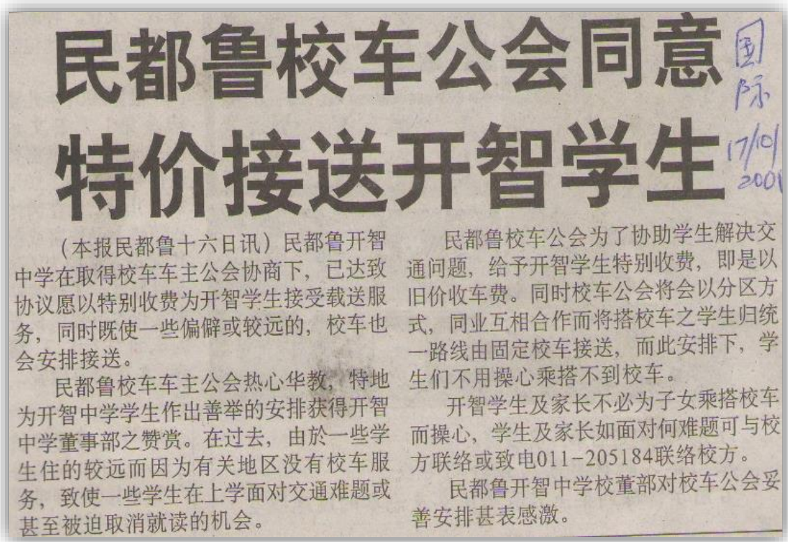
图 33：民都鲁校车公会同意特价接送开智学生报导