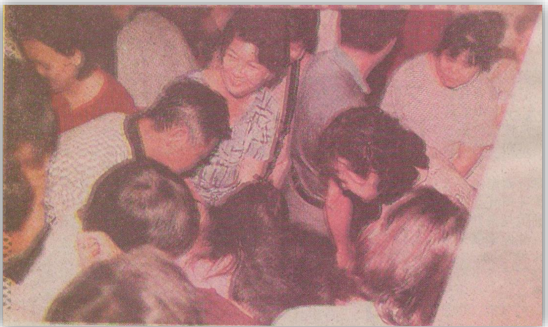
图 12：家长争先抢夺开智中学报名表格