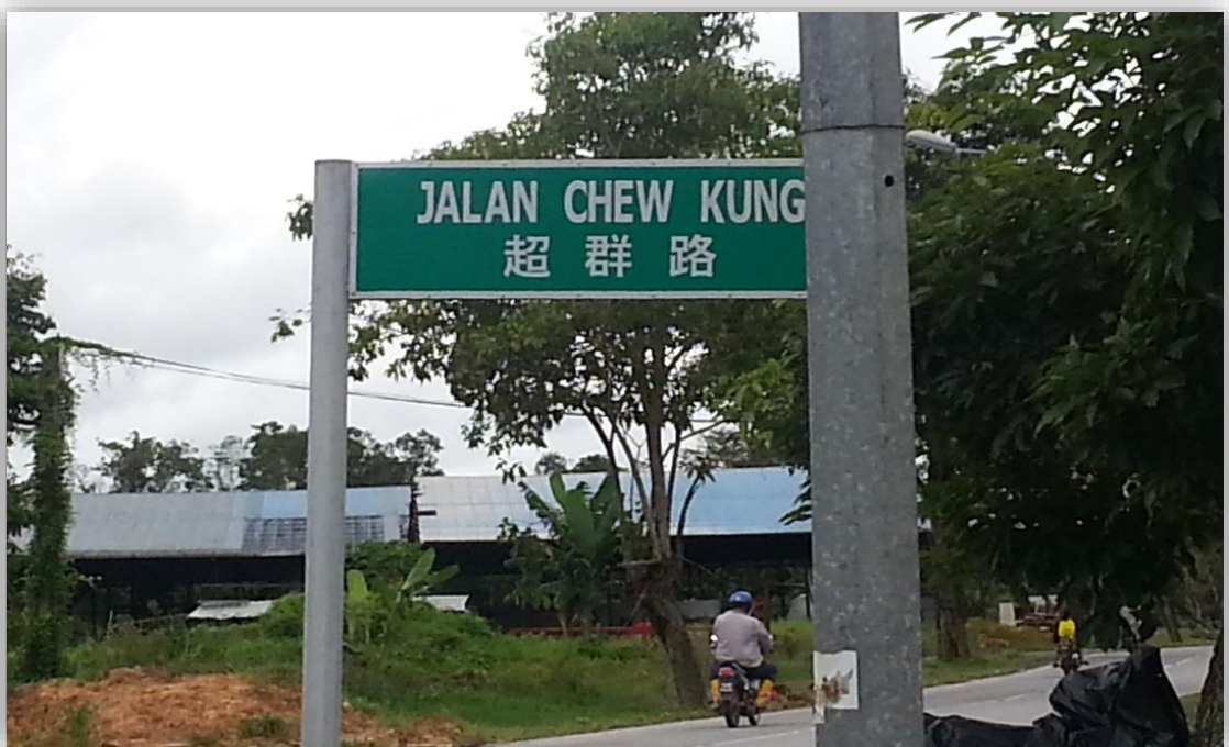
图 6：开智学校路口（超群路）