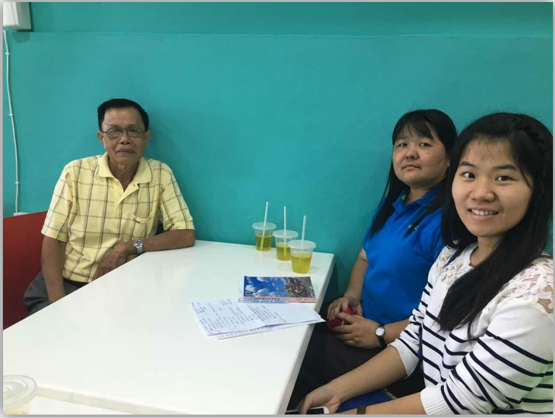
资料来源：摄于诗巫大星百货底楼 sugarbun 快餐店