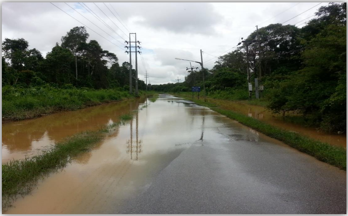
图 7：开智小学路口受阻