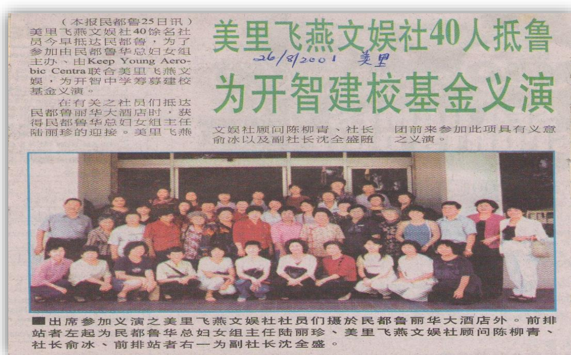
资料来源：取自 2001 年 8 月 26 日《美里日报》