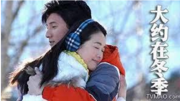
图六《大约在冬季》剧照 19

对面》尽管尚未播出，但其 VCD 已经悄然在全国销售了数十万套，这说明，中国的偶像剧拍好了，完全可以与风靡一时的韩日偶像剧一争高低。