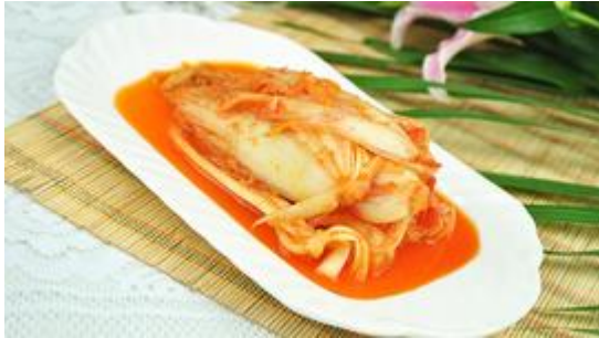
图七 韩国泡菜剧照 50

菜腌制就变的必不可少。韩国的泡菜不但味美、爽口，而且具有丰富的营养，是韩国餐桌上不可缺少的主要开胃菜。韩国人中流行的说法：“没有金齐（韩语：咸菜）的饭不是给韩国人准备的。”