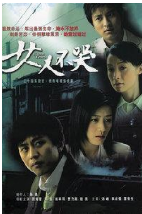
图四《女人不哭》剧照 10

把职业女性生存状态的转变表现的冷静、客观，给出思考的余地。同时导演陈铭章就这一故事叙述方式介绍说：“电视剧《杜拉拉升职记》有些会让所谓的职场新兵学习的内容，但是更重要的学习是在后面一部分。可以让这些所谓的职业女性懂得生活，可以让她们懂得“踩刹车”。”《杜拉拉升职记》在中国的成功还体现在随后推出的电影版《杜拉拉升职记》，以及延伸到《杜拉拉升职记》第二部《杜拉拉之似水年华》，在中国也取得了非常好的评价，由此可见《杜拉拉升职记》在中国的影响是有积极延续的价值，开创了中国特色女性励志题材时代剧的先河。