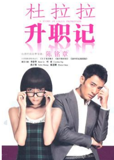
图三《杜拉拉升职记》剧照 6

首先，笔者之所以选择《杜拉拉升职记》和《女人不哭》的原因是：自《杜拉拉升职记》播出以来，据 2010 年的央视索福瑞数据 7 显示，《杜拉拉升职记》在 2010 年就拿下了中国的东方卫视 8 和北京卫视 9 的双料收视率冠军。这部电视剧在东方卫视的播出的当天开始就成为了这一年度收视率最高的电视剧，当年 7 月底，《杜拉拉升职记》在北京地区的收视率就以 7.56 登顶(腾讯网，2010)。腾讯娱乐报道（2010）中指出，电视剧《杜拉拉升职记》以职场“灰姑娘”杜拉拉从“菜鸟”到精英的精彩过程，该剧一方面用杜拉拉的成功成长传授职场成功秘诀，一方面又以薇薇安、Rose 等人的隐退教会职业女性功成隐退，学会停步，