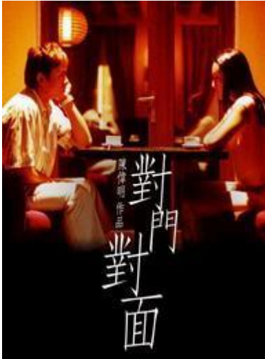
图五《对门对面》剧照 16

往，向大家展示了美好的爱情、诚挚的亲情友情才是人生中最宝贵的财富，是生活中不可或缺的重要内容，反应的主题与价值观《冬季恋歌》相似。