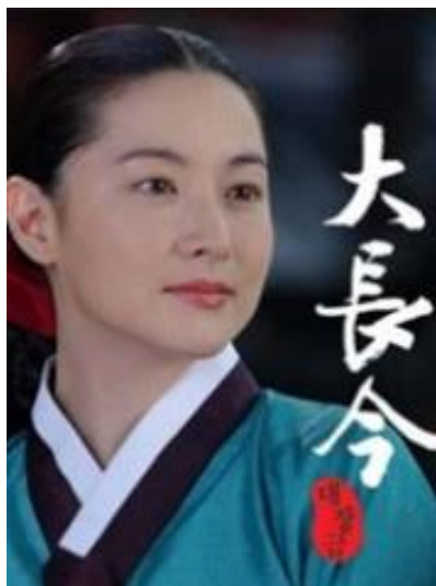
图一 《大长今》剧照 3

的收视率神话，此后，《大长今》被台湾引进，并最终创纪录的收视顺利迈出它红遍亚洲的第一步，《大长今》在中国大陆接档《超级女声》在湖南卫视播出后，以平均收视份额 17.3% 的表现稳居全国同时段收视排行榜的第一位。”新华网（2005）提到：“韩国“国民电视剧”《大长今》播出 10 多年，陆续登上 90 多个国家电视荧屏，成为韩剧走向世界的标志性作品，为“韩流”风靡全球做出突出贡献。《大长今》播出后，在全亚洲掀起了“长今”热，红遍了整个中国，《大长今》带动了韩国料理、旅游等一系列相关产业，《大长今》“侵袭”过的地方，相关小说，音像制品被抢购一空；《大长今食谱》也成为家庭主妇的宠儿（董旸，2008:40）。另外，中国影响最大的报刊“人民日报”甚至在 2013 年 9 月 19 号报道了对比中国当红电视剧《甄嬛传》，《大长今》的价值观更正确，更值得宣扬。