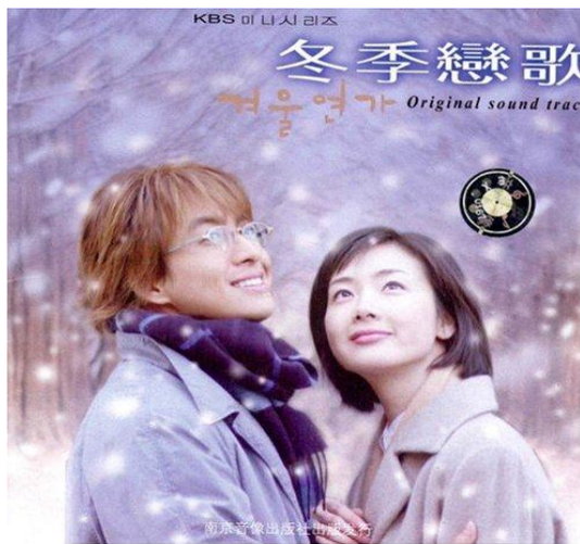
图二 《冬季恋歌》剧照 4

国旅游发展局及《辽沈晚报》共同主办的“韩剧十年十大经典韩剧评选”活动，共有 290 万 7148 名中国网友参与投票，排在人气榜第一位的是《冬季恋歌》，这部诞生了裴勇俊这位杰出的韩流巨星的电视剧，以其让女人心动不已的缠绵动人的爱情故事，稳稳抢占了“中国荧屏”（搜狐网，2007）。根据中国娱乐网（2013）的数据，《冬日恋歌》首播创下了 16.3%（AGB Nielsen）的收视率，每一集的平均收视率都高达 23.1%，受到了很多人的关注。与《大长今》略有不同的是，《冬季恋歌》的播出时间较早，它的影响力并不是只是体现在收视率方面，而更多影响的是大众的娱乐生活，审美追求，甚至带动了韩国经济的发展。中国文明网的（2013）报道中指出：“2002 年韩国影星裴勇俊主演的电视剧《冬季恋歌》在亚洲引起了广泛的追捧，并带动了韩国旅游 15% 的增长，裴勇俊个人为韩国创造财富 23 亿美元”（中国文明网，2013）。