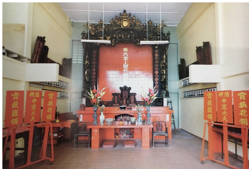
图 7：雪兰莪暨吉隆坡叶氏宗祠祠堂