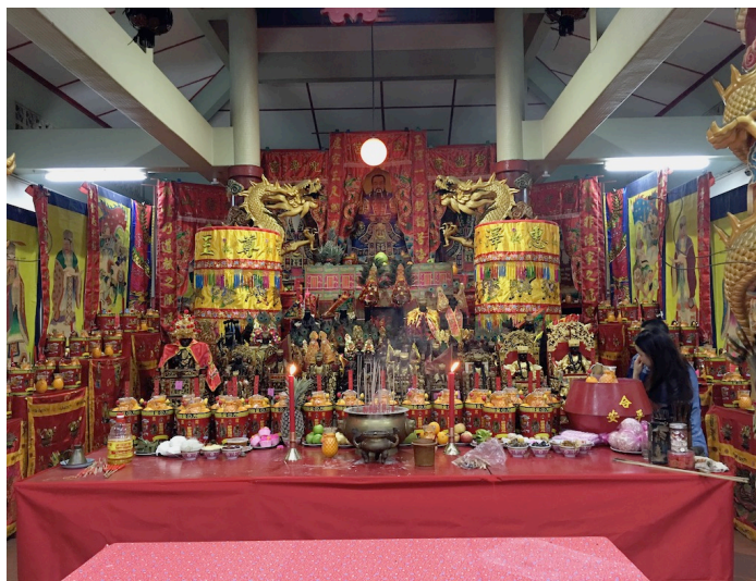
图 13：泗岩沫南阳宫千秋华诞

吉隆坡四间南阳宫都设有“炉主和头家”的制度。凡是捐香油钱的善信可以选择是否参与炉主或头家的选举，这种选举通常是在惠泽尊王千秋华诞庆典结束后的晚上进行。仪式由庙方的理事主持，先向惠泽尊王念出善信们的名字，然后掷圣杯决定。凡是得到最多圣杯的乐捐者将当选为来年的“炉主”。此外，得到三个圣杯的乐捐善信一概出任“头家”，直到额满为止。每逢初一、十五炉主更是必须到南阳宫烧香膜拜。如果遇到特别的日子，如神诞或举行建醮，炉主必须代表庙宇同仁以及全体善信跟在作法的道士背后，手持清香向神明顶礼膜拜。