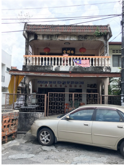
图 11：美联园南阳珠明宫