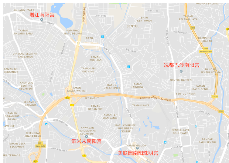
地图 1：吉隆坡四间供奉惠泽尊王祠庙的地理位置 14

马来西亚远在英国殖民地政府统治之下，就已经实行宗教信仰自由的政策，各民族可以自由兴建寺庙或教堂作为膜拜祈祷之用。政府不但不加以阻扰，有时还会资助款项予以玉成。独立后的马来亚政府，秉承着过去的传统，尊重各民族的生活习惯，每年在宗教方面所拨出的款项数以百万元计。寺庙除了享有水电费半价的优惠之外，人民筹建寺庙时还可以向政府申请土地和拨款。（朱金涛，1992：29）目前在吉隆坡共有四间供奉惠泽尊王的祠庙，其中包括了泗岩沫（Segambut）南阳宫、增江（Jinjang）南阳宫、洗都巴沙（Sentul Pasar）南阳宫和美联园（Taman Million）南阳珠明宫。这四间供奉闽籍叶氏祖神的祠庙的地理位置都非常靠近。因此可以透过此现象探知闽籍叶氏宗族在此区域聚居的分布状况。