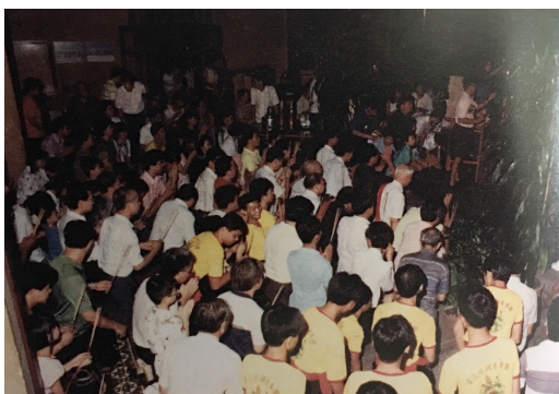
图 15：槟城的闽籍叶氏宗族迎接惠泽大尊王驾临