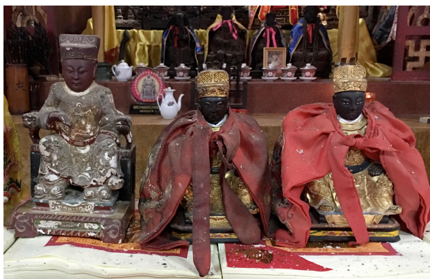
图 2：无案桌的惠泽尊王金身

图 1 为惠泽尊王的金身造型，其金身造型都是呈现坐姿状态。而用色方面，皮肤采用棕红色为主，服饰则采用金色为主。大部分的惠泽尊王金身都有案桌 10 ，有些惠泽尊王金身则无。