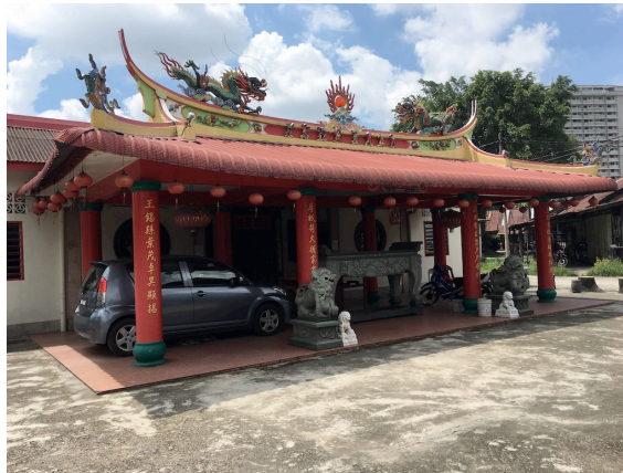
图 10：洗都巴沙南阳宫