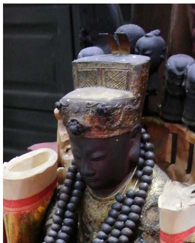
图 3：惠泽尊王的王帽绘有双龙戏珠并镶上金钗

惠泽尊王金身的服饰是头戴王帽，王帽绘上双龙戏珠图案，而且王帽顶部还会镶上两个金钗。