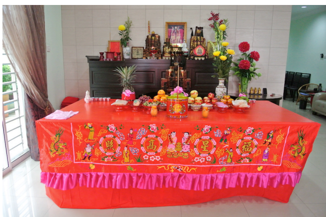
图 21：闽籍叶氏宗族迎接惠泽尊王到家里参与祭祀仪式