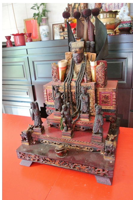
图 1：惠泽尊王金身 9