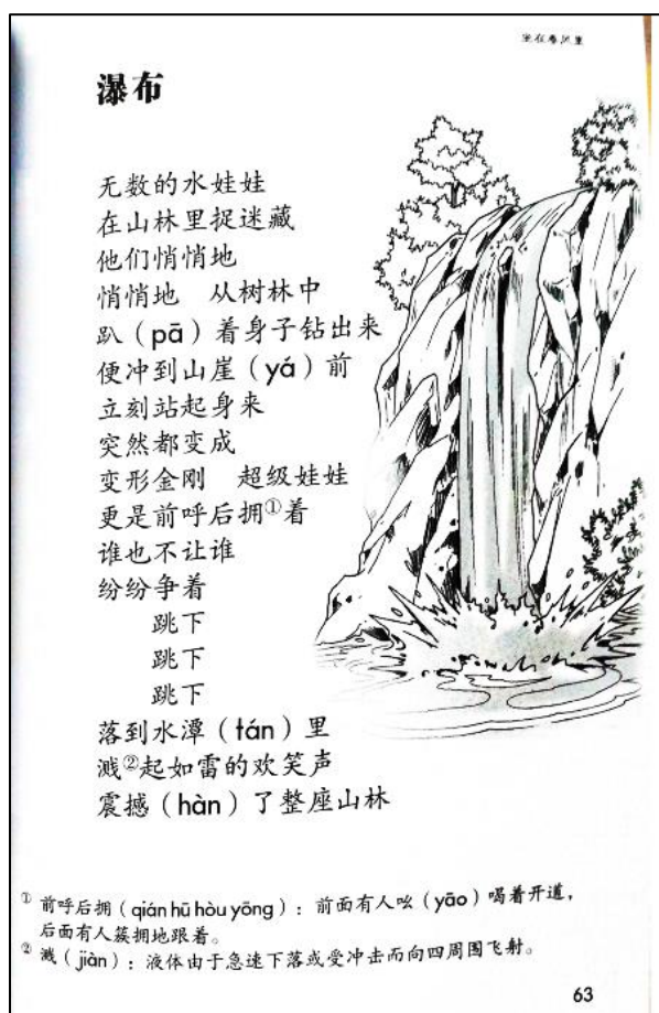
图（一） 35 ：梁志庆童诗整体形式。

如果是以在童诗集里一首童诗为一页的整体形式来看，本文发现梁志庆在童诗整体形式上有其细心之处。梁志庆在其童诗作品里如果使用了他认为是一些比较难理解的文字，就会在其作品下方做脚注，附上其词语的汉语拼音和词语解释。以下图一为其童诗整体形式的例子：