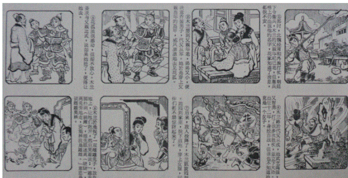
图 1：连环图〈扑朔迷离〉

根据罗春梅〈《儿童乐园》（1953-1994）图文叙事分析〉，“连环图故事可以分为两大类，分别是改编自中外经典民间故事和儿童生活故事”（罗春梅，2018：88）。连环图的特征是图文相结合，每个图都是附带文字连续性排列讲述故事。就如：