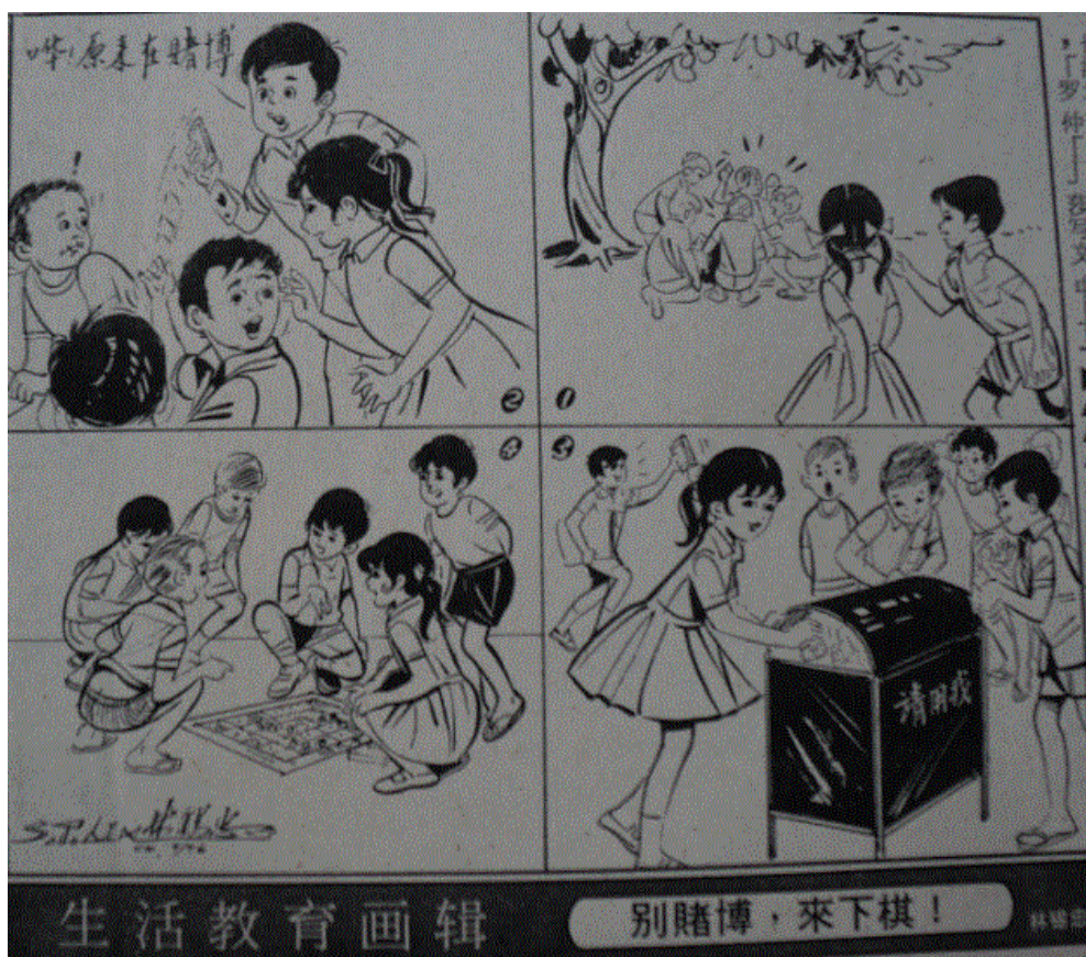
图 3：漫画〈生活教育画辑-别赌博，来下棋〉