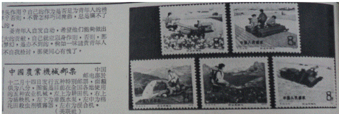
图 2：图解〈中国农民业机械邮票〉