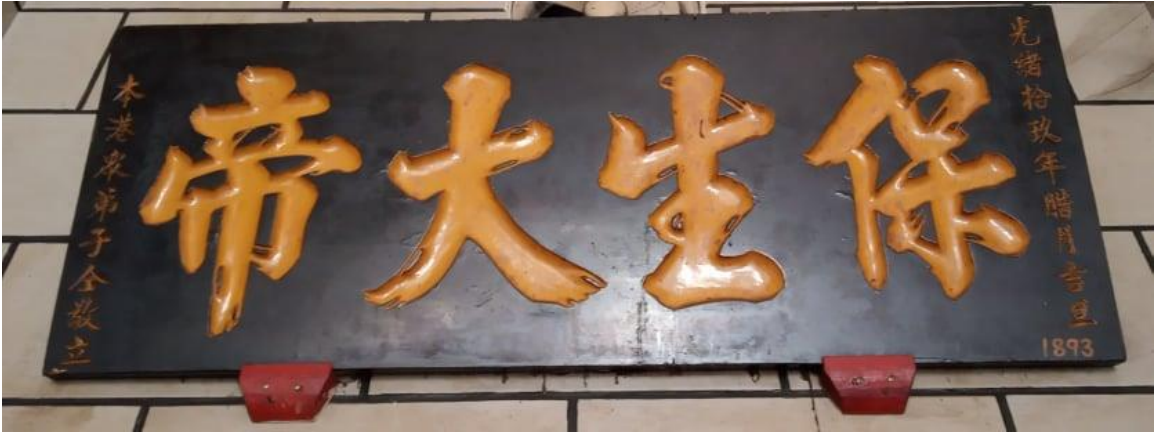
图1 “保生大帝”牌匾

除了牌匾之外，笔者也发现了两块分别是光绪十九年（公元1893年）和光绪卅三年（公元1907年）的清代功德碑，和一块写有“中华民国廿六年岁丁丑十月”即公元1937年的功德碑。这些石碑相信都是为了记载乐捐者名字而立，其中刻有光绪十九年（公元1893年）年号的石碑（图2）再次证明了圣古庙成立的年份，只可惜某些字已剥落。其石碑的原文如下：