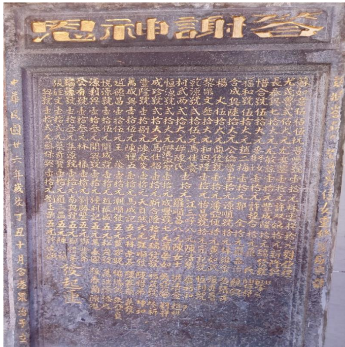
图4 “答谢神恩”石碑