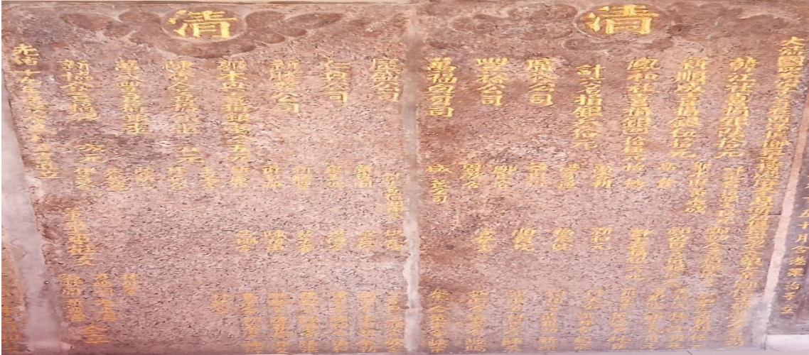
图2 光绪十九年（公元1893年）的功德碑（罗国玮摄于2020年1月27日）

除此之外，笔者又在庙里主坛的左侧发现了另一块刻有和光绪卅三年（公元1907年）的石碑（图3），值得一提的是这块石碑保存得相当完好，没有碑文剥落的情况。同样的，该石碑也是为了记录捐建者的名字而立。不过，笔者发现这石碑所刻的地方名已经从最初的麻冬息海改为峇冬息海，这也记录了峇眼色海地方名的演变史。石碑的原文如下：