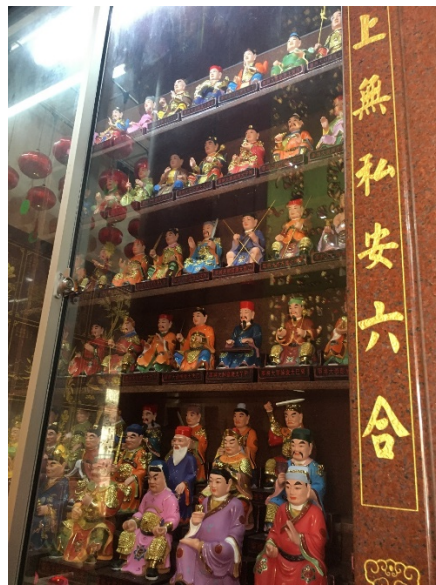
图（14）：图为专门安置太岁的神柜，加上当值太岁，一共有六十尊，俗称“六十甲子”。

大伯公庙正殿左侧供奉了三个神祉，从左到右依次是协天大帝、诸神娘娘和玄天大帝。协天大帝也可被称为“关公”。正殿右侧也供奉了三个神祉，分别是天后圣母、观音娘娘（观世音菩萨）和广泽尊王。天后圣母可被称为“妈祖”。另外，在签诗正下方供奉着土地公。