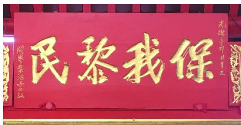
图（1）：图为正殿悬挂的“保我黎民”匾额，匾额上刻着“光绪辛卯年秋月立”和“闽粤治子全敬”。

由于年代久远，再加上筹建大伯公庙的功臣名字当时没有以任何的形式被记录下来，如今可说是无迹可寻。唯一留下的痕迹就是仍然挂在大伯公庙正殿上的匾额“保我黎民”。这个匾额的年代久远，立于光绪辛卯秋月的时候，由闽粤治子敬献。 15 由此可推断出建立大伯公庙的最大功臣是福建厦门籍的人士。另外，有一部分华人将经商的范围拓展到内陆地区，去到内陆的唯一办法就是依靠邻近马鲁帝的峇南河。这条水路十分凶险，经常发生意外。华人都希望神灵可以保佑他们。因此，远在内陆的华人不仅出钱出力，对建庙之事更是积极至上。直至今日，大伯公庙里仍然存放着内陆地区的华人所赞助的银器和香炉。