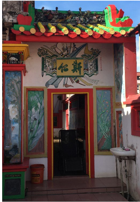
图（10）：图为大伯公庙正殿右侧刻的“斯仁”辞句。

从大伯公庙的入口进门，我们可以看见在正殿两旁各有一扇门，左右两旁的门分别对应着由义、斯仁。虽说并无历史记载为何将“由义”和“斯仁”二字刻在侧门上，但是据前人考察，其意义是依照孔子和孟子之学说。这也是创庙的宗旨，为的是要善信们保持仁义的态度。