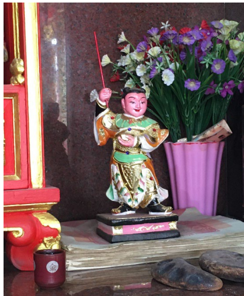
图（12）：图为大伯公庙左侧的“二师父”。

在大伯公神坛左侧有一尊看起来像是小孩的金身，被称为“二师父”。据悉，“二师父”是福州籍贯人士的神祉。右侧则是现年当值的太岁金身。根据采访得知，在还没有太岁金身之前，庙祝会用一张红色的纸，在纸上写下当值太岁的名字贴在墙上，供善信膜拜。但是在大伯公庙装修过后，华人慈善信托委员会就从中国将“六十甲子”请到马鲁帝大伯公庙，在当值太岁右侧有一个专门置放太岁的神柜。每一年的年初一就会将当值太岁安在福德正神右边。