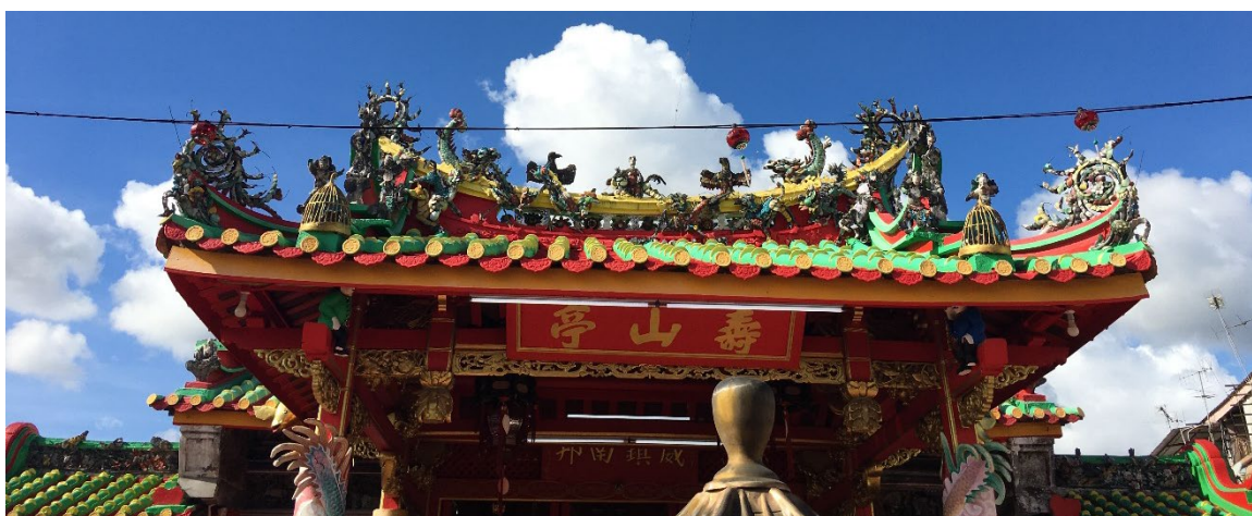
图（4）：图为马鲁帝大伯公庙正殿屋顶，采用了歇山式屋顶，正脊被刻意砌高一层，两端向上收束，尾部分为两个细支（燕尾脊）。正脊上从左到右依次是龙、狮、凤凰、仙人走兽、凤凰、狮和龙。

凤凰。王便骑上凤凰逃走，化险为夷。 19 另外，马鲁帝大伯公庙的正脊有被刻意地砌高一层，以起到以其重量缓定屋瓦的效果。大伯公庙正脊的两端向上收束，尾部分成两细支，看起来像燕尾，所以亦被成为燕尾脊。位于大伯公庙屋檐尾端的半圆形瓦称为筒瓦，有图案的圆形部分被称为瓦当，适合供雨水下落的尖型“滴水”同为屋顶的构件。