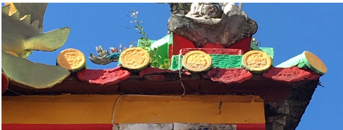
图（5）：图为大伯公庙屋瓦。位于尾端的半圆形瓦称为“筒瓦”。带图案圆形部分称为“瓦当”。