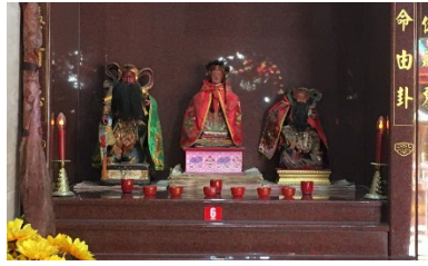
图（15）：图为协天大帝、注生娘娘和玄天大帝金身（从左到右）。