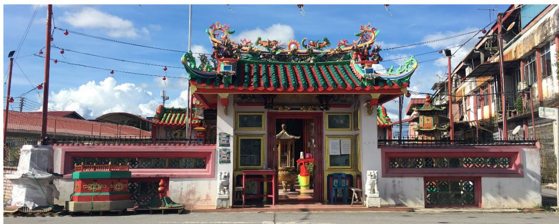
图（2）：图为马鲁帝寿山亭外观，仍旧保留前清时期的装修格调。

在众人努力地筹足建造庙宇的费用之后，马鲁帝华人领袖就从古晋聘请了来自中国的庙宇建筑的名匠为建造属于马鲁帝人的大伯公庙。不仅如此，马鲁帝大伯公庙亦成为全砂唯二仍旧保持前清时期格调的传统庙宇。根据特刊记载，名匠姓沈。马鲁帝大伯公庙的屋顶承袭了中国闽南粤东一带传统庙宇的建筑特色，结合了硬山和歇山的两种形式的造型。硬山是人字形屋顶的一种，由二庇和五脊所组成。 16