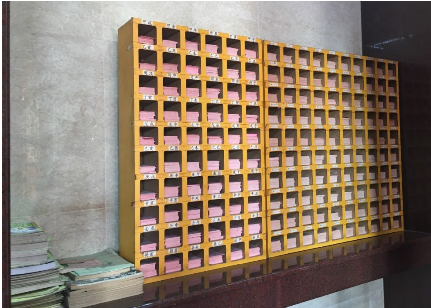
图（9）：图为签诗和药签。左侧的书籍为用于记录签的解说书。