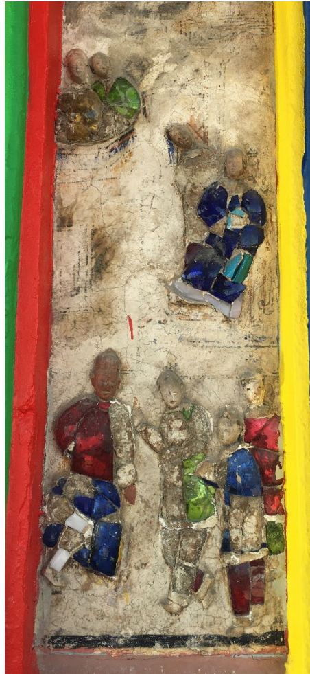
图（6）：图为大伯公庙里仅存为数不多的剪瓷画之一。

大伯公庙的柱梁构造是迭斗式，从这里可以体现出传统建筑对技艺和艺术结合的重视。大伯公庙的柱梁上都雕刻着栩栩如生的祥兽木雕，既美观又起到了支撑的作用。柱梁交角的雕木构件一般被称为托木，主要是用来稳定梁柱，为的是防止移位的现象发生。但是马鲁帝大伯公庙在经历了百多年时间的洗礼，再加上大伯公庙位置处在河边，河岸的泥土已经松陷，所以大伯公庙天宫殿的柱梁上端其实已经出现了少许的位移。虽不致影响天宫殿屋顶，但是由于缺少古庙的技术人员修缮，因此维修计划也只能作罢。