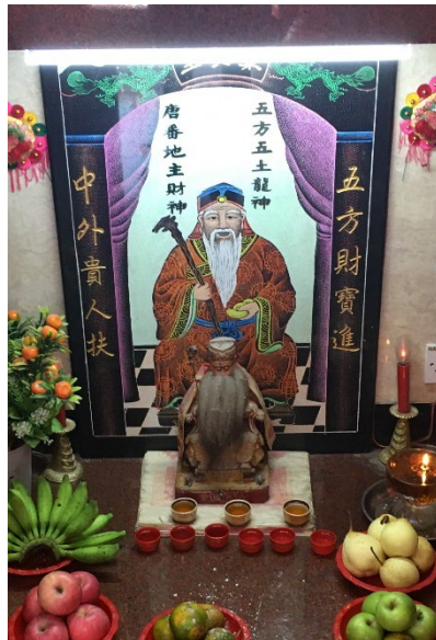
图（17）：图为土地公神祉。