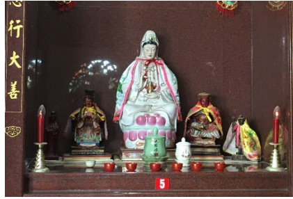
图（16）：图为天后圣母、观音娘娘和广泽尊王金身（从左到右）。