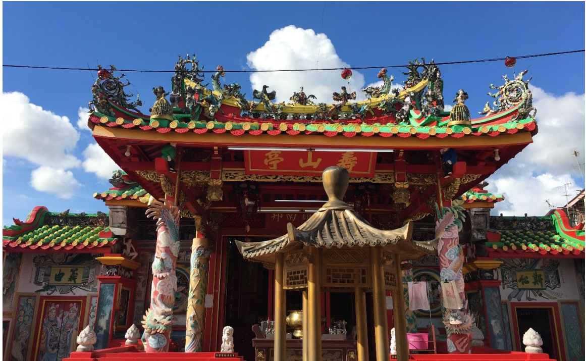
图（3）：图为马鲁帝大伯公庙正殿外观。

歇山式屋顶是一种高等级的屋顶形制，屋顶四面放坡。 17 屋脊会呈现下垂的曲线，可根据位置的不同分为正脊、战脊、垂脊等等。此外，大伯公外屋顶上的装饰大多都集中在正殿和山门尾脊的部分。这些装饰的作用主要是为了增添大伯公庙艺术形象的美感和起到驱逐魔邪、辟邪趋吉和防灾灭火的作用。正脊指的是沿着前后坡面相交处的屋脊，位于建筑体的最高处。 18 由于正脊所处的位置一般都比较显眼，所以正脊就被视为传统建筑中最重要的装饰位置。因此，马鲁帝大伯公庙正脊上的装饰可说是十分地丰富和巨大。大伯公庙正脊顶装饰物就有仙人走兽、凤凰、狮和龙。人们之所以把仙人走兽放在正脊的正中间就是因为仙人走兽在民间的形象象征着逢凶化吉。传言，齐泯王（有者说是闵王）在作战时被敌军追杀到大河边，在他们无法渡河又无路可逃的时候出现了一只