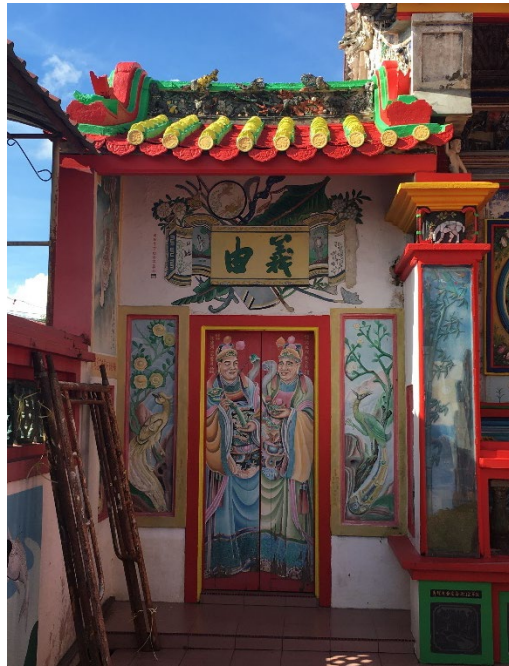
图（9）：图为大伯公庙正殿左侧刻的“由义”辞句。