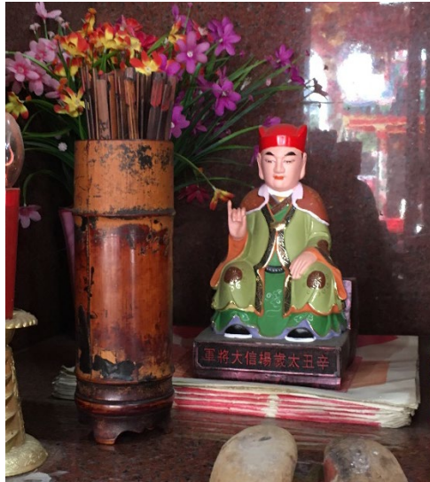
图（13）：图为现任当值太岁。