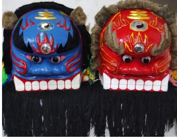
图 4-2-4：不同颜色的客家狮头