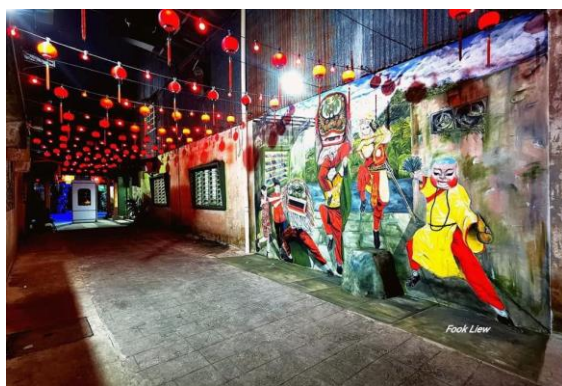
图 5-2-2：新尧湾客家狮壁画

多元文化向来是砂拉越作为旅游景点的标榜之一，故此无论官方或民间都非常积极挖掘本土人文历史作为吸引游客的元素。目前而言，客家狮在砂拉越的流传相对其他州属完善，例如西马不少地方的客家狮已经失传，包括河婆人聚集的柔佛古来已经失传许久。目前，古来的客家狮队已从古晋聘请教练传授。因此，客家狮已可以成为砂拉越旅游文化的资源之一，除了“马来西亚客家狮王争霸赛”在古晋举办，客家狮也成为当地的特色。譬如，临近石隆门的新尧湾市镇是一座华人小镇，居民几乎是河婆客。该镇本就是到访砂拉越古晋的热门景点之一，后也有壁画家到该处绘出一幅以客家狮为主题的壁画。 77 实际上，该镇每年的水月娘娘出巡都有客家狮队参加。