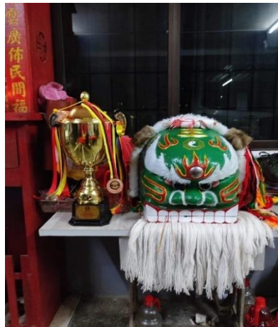
图 4-2-3：不同设计的客家狮头

他坦诚开始创新时会招来非议，如被师兄弟指责是破坏传统。但改良之后，眼见客家狮更容易被现代接受，于是其师兄弟也开始认同，并学习其改良手法。