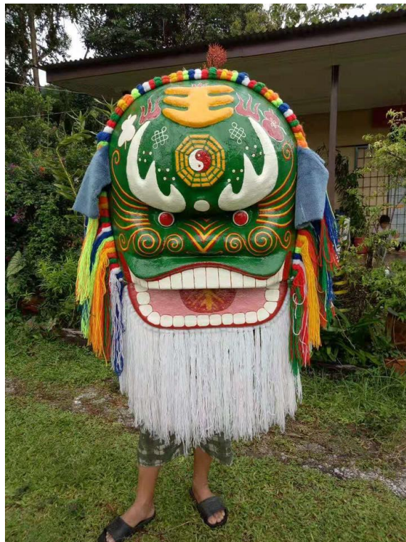
图 4-2-2：改良的客家狮头