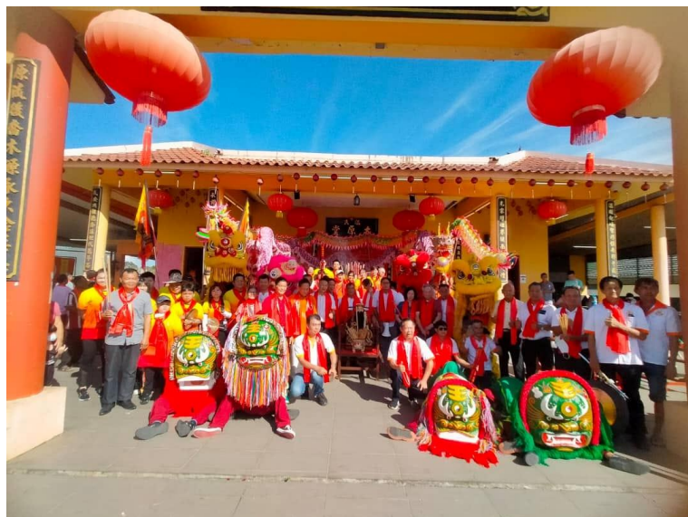
图 5-2-1：2023 年古晋石角温氏公会祭祖请客家狮助兴

随着客家狮重新打出名堂，华社不同类型的公会都开始会邀请客家狮表演助兴，如以籍贯方言为主的公会（砂拉越客属公会、古晋河婆同乡会）、以血缘为主的公会（如温氏公会、钟氏公会等）。