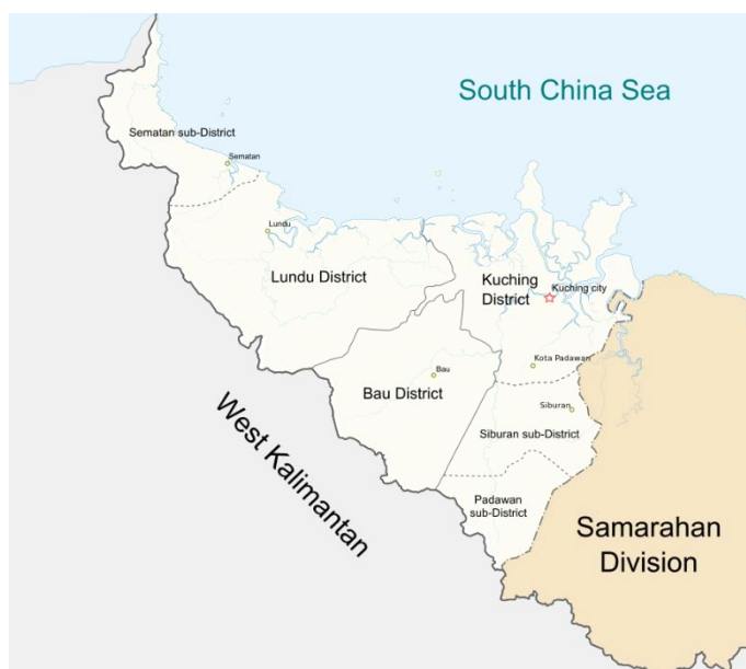
图 1-3-1：砂拉越古晋省行政区划分（白色区域为古晋省）

本文研究地点将会锁定在马来西亚砂拉越的古晋省，即文中所用的“古晋”为古晋省。古晋省包括其治下的古晋县（Kuching District）并包括巴达旺副县（Padawan sub-District）、石隆门县(Bau District)，以及伦乐县(Lundu District) 并包括三马丹副县（Sematan sub-District）。 4