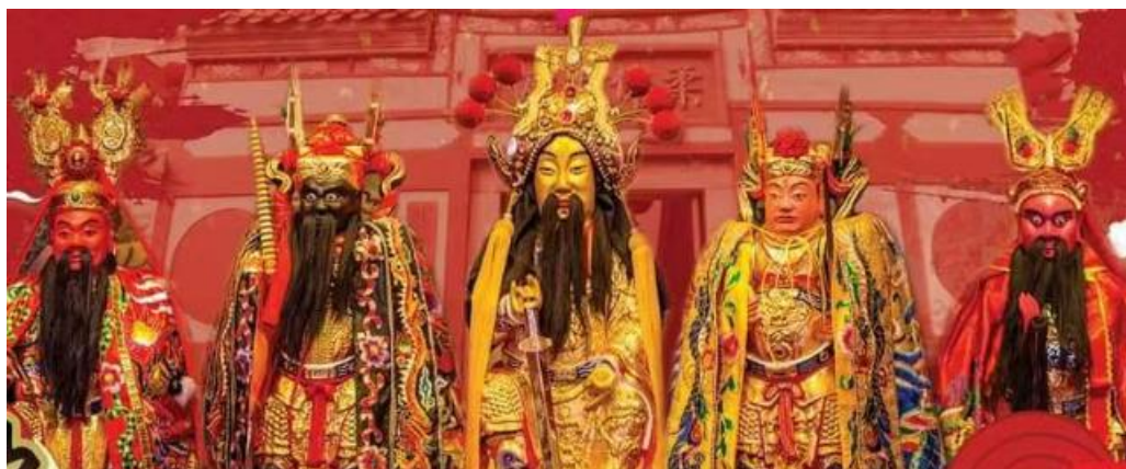
图5-2-2：古庙神像排列（从左起依次为感天大帝、赵大元帅、元天上帝、华光大帝、洪仙大帝）