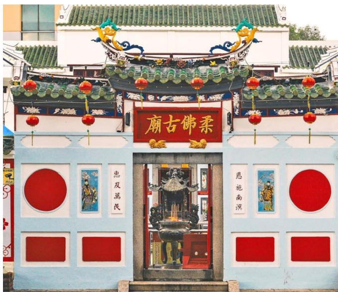
图5-2-1：柔佛古庙外部的潮州建筑风格

1920年以前，古庙的五尊神明便开始由新山的五个主要帮群各自负责：主神元天上帝由潮州人所负责、洪仙大帝由福建人负责、感天大帝由客家人负责、华光大帝由广府人负责、赵大元帅为海南人负责 64 ，这样的传统一直延续至今。