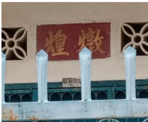
图 3.29：哲仁新村燉煌堂号