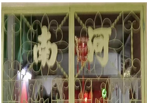
图 3.8: 哲仁新村河南堂号