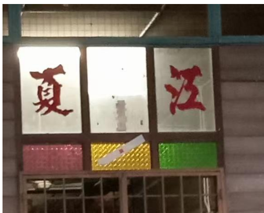
图 3.24：哲仁新村江夏堂号