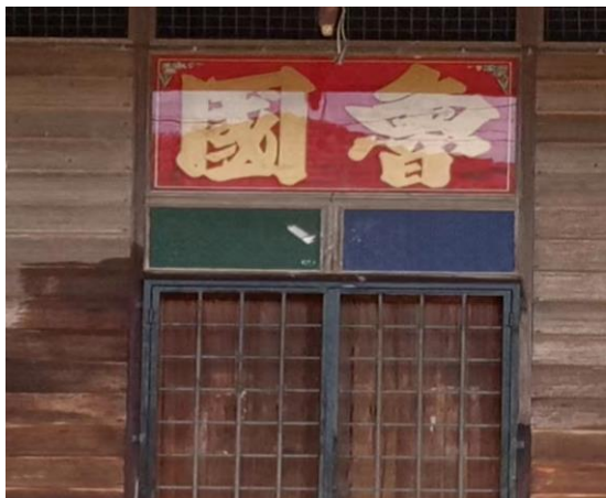
图 3.15: 哲仁新村鲁国堂号