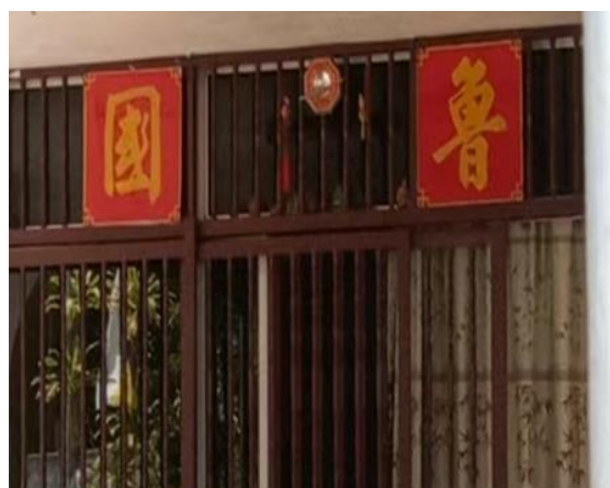
图 3.18: 哲仁新村鲁国堂号