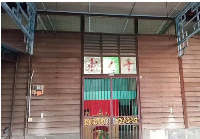
图 2.2：哲仁新村中仍保留堂号的住家之一