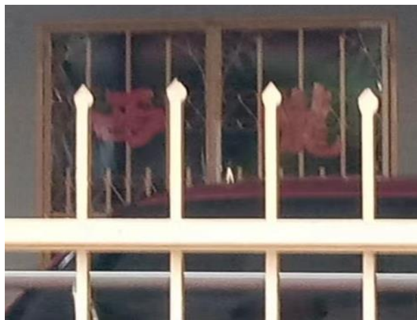
图 3.3: 哲仁新村陇西堂号