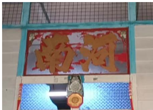
图 3.7: 哲仁新村河南堂号