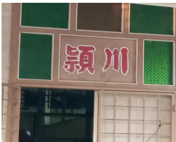
图 3.19：哲仁新村颖川堂号

颍川堂号的房屋可谓是非常稀少，仅有着区区 3 间。颍川，古称，现今的河南禹县，是中国秦朝到唐在河南所置的一个郡，在汉晋三国时期，是豪门士族聚集地之一。 64 不仅如此，颍川于历史之中一直是大郡，设立以来一直都是京师之外人口最多，最为繁华的地方。根据历史记载，颍川可谓是人才辈出，是作为中华民族主要的发祥地。其中有黄帝生于此，夏禹也建都于颍川。颍川因此成为中国众多姓氏的发祥地。 65 而陈姓便是以颍川为堂号，表示陈姓的先祖是作为当时颍川地域的望族。因此，刻有颍川堂号的住家、村子亦或是祠堂等人士都极大可能是源自颍川迁徙而来的某姓氏后裔。 66 通过走访哲仁新村了解到，哲仁新村之中保留着颍川堂号的房屋都为陈姓，其中图 3.19 的住家则因被租给印尼劳工，而无法得知原住家主人的姓氏。而值得关注的是，这些家户堂号所使用的颍川堂号，都纷纷出现了错别字，如图 3.19 至图 3.21 所示般，都将颍川写成了颖川。