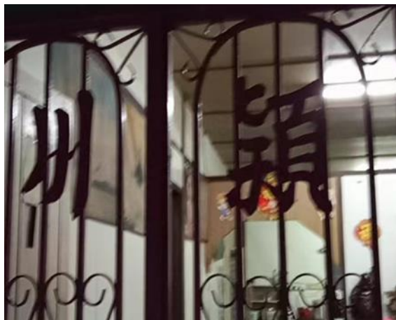
图 3.20：哲仁新村颖川堂号