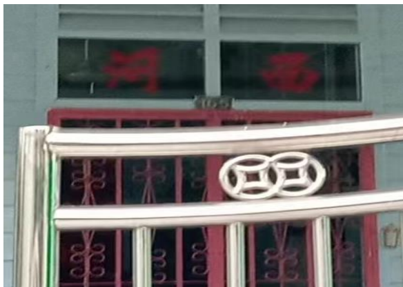
图 3.13: 哲仁新村西河堂号