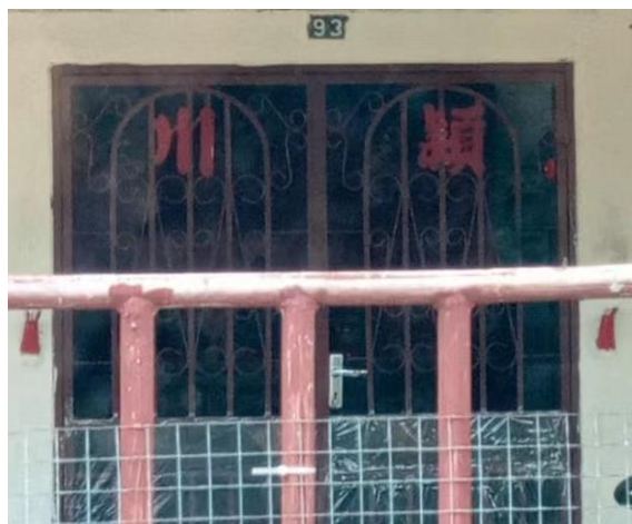
图 3.21：哲仁新村颍川堂号