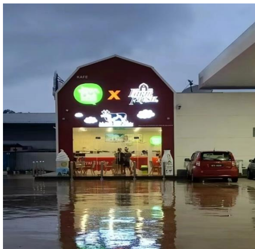
摄于 2023 年 11 月 23 日

目前，由于人人都望着要向外发展而间接致使了村内大部分的青年人都纷纷往外发展，不愿留在村内。再者，哲仁新村的工作发展机会可谓是少之又少，在面临僧多粥少的情况之下，年轻人也只能选择另谋出路，争取向外发展。由此也造就了哲仁新村村民逐渐稀少的原因，大部分村民在外发展成功后，多会选择举家搬迁以求更好的生活。但目前的哲仁新村虽说工作机会不多，但也逐渐迈向先进化。例如，如上所述哲仁新村里增设了羽毛球馆、篮球场、免费的健身场所，让村民闲暇之余也能兼顾身心健康。