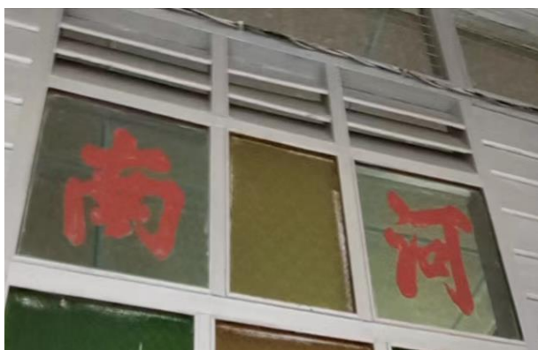
图 3.10: 哲仁新村河南堂号