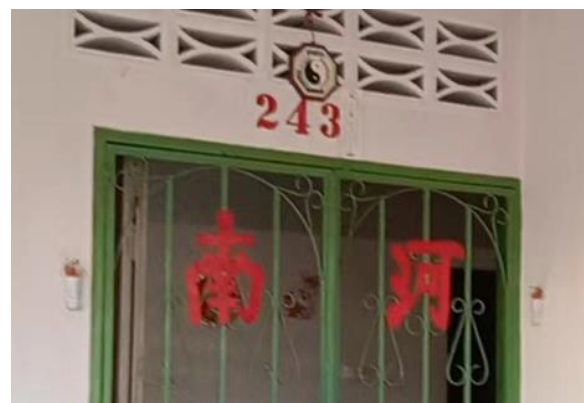
图 3.9: 哲仁新村河南堂号