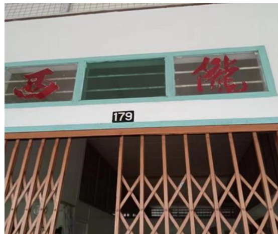
图 3.4: 哲仁新村陇西堂号