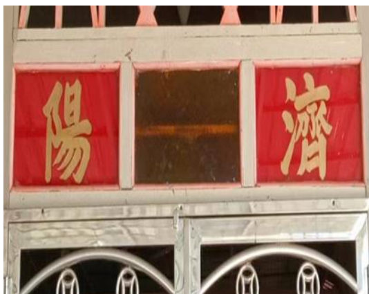
图 3.25：哲仁新村阳济堂号