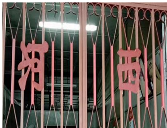
图 3.12：哲仁新村西河堂号