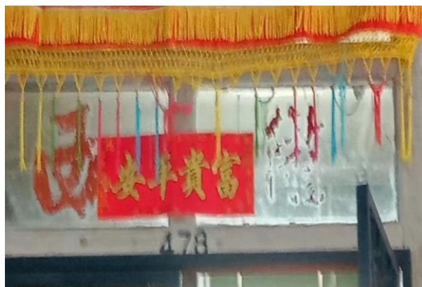
图 3.5: 哲仁新村陇西堂号