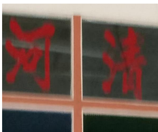
图 3.22：哲仁新村清河堂号

哲仁之中较为少数的堂号分别包括了表 3.1 所示图 3.22 的清河（张姓）、图 3.23 的京兆（杜姓）、图 3.24 的江夏（黄姓）、图 3.25 的济阳（蔡姓）等。