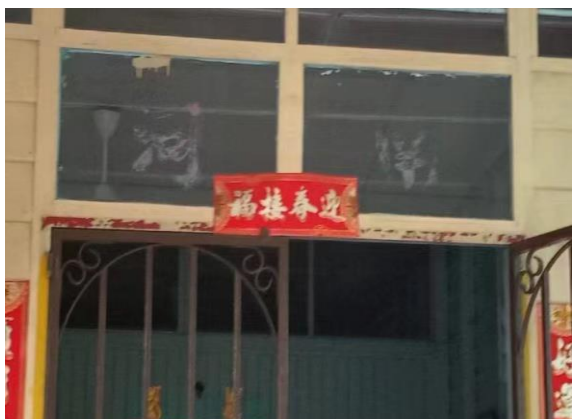
图 3.6: 哲仁新村河南堂号