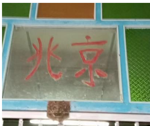
图 3.23：哲仁新村京兆堂号