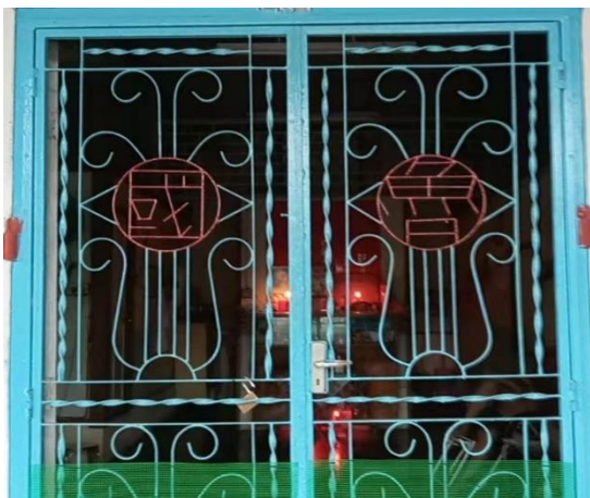
图 3.1：刻在铁花门的鲁国堂号

如上所述，中国堂号一般都书写在一个匾额，悬挂于厅堂之上。与之不同的是，哲仁新村的堂号并非书写于匾额之中，而是如图 3.1 和图 3.2 所示般，早已于建造房屋时便已刻在了前门上方或是在铁花门上镶上各自的堂号。因而形成了前门上方位置及铁花门上刻有堂号的特色。