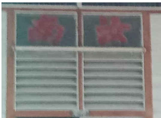
图 3.26：哲仁新村汝南堂号

而其中也有因房屋已成空置屋，找不到房屋持有者而无法得知该堂号的姓氏，如图 3.26 的汝南、图 3.27 的冯翊、图 3.28 的彭城等堂号都仅仅只有一间，却因空置而无法得知房主姓氏。