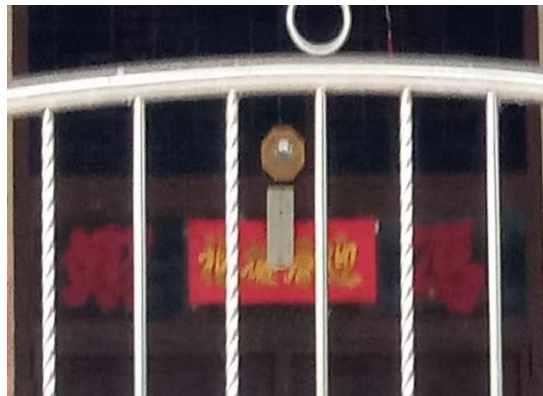
图 3.27：哲仁新村冯翊堂号