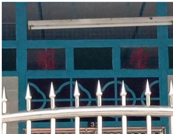
图 3.16: 哲仁新村鲁国堂号