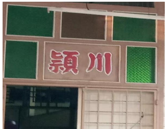
图 3.2：刻在前门上方的颍川堂号