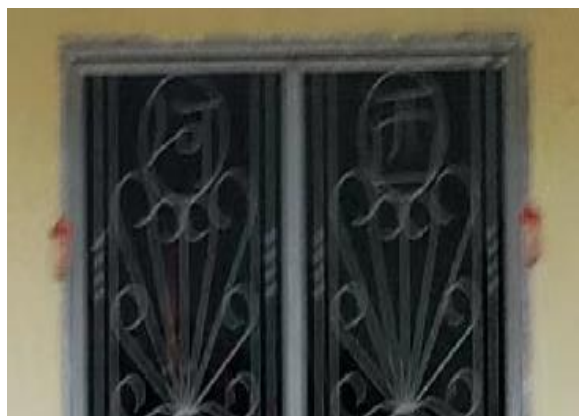
图 3.11：哲仁新村西河堂号

其次，于哲仁新村之中数量位列第 2 的堂号，分别是西河堂号以及鲁国堂号。如表 3.1 所示，西河堂号及鲁国堂号各有 4 间。根据史料记载林姓的堂号之所以是西河堂原因则为当时殷商太师，既干被商纣王所害，而其夫人陈氏已有身孕且成功逃出，于长林石室之中诞下一男婴，名泉，字长恩（林氏受姓始祖）；之后，周武王姬发灭商建周后，旌表比干忠烈，便徵觅其后嗣，命闾夭给太师比干于朝歌南汲境内（今卫辉）封墓。其夫人也携带其子回周，也因生于长林石室，而被周武王赐姓林名坚。而后念他为商汤之后先王之胄，且能远避纣乱而不绝其世，而封其为大夫；后有封其为博陵公，食采二千户，采邑博陵（今河北安平县），故林氏总堂号为西河堂。 61 而笔者通过走访了解新村保留着河西堂号的村民也都为林姓，而其中有一家既图 3.11 则是空置屋，找不到房主而无法得知此堂号的姓氏是否同为林姓。