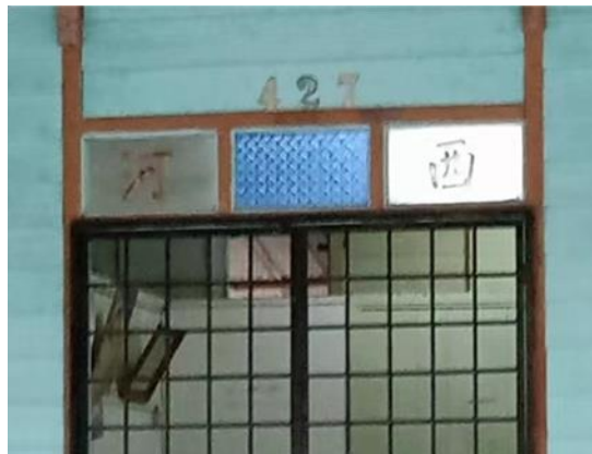
图 3.14: 哲仁新村西河堂号