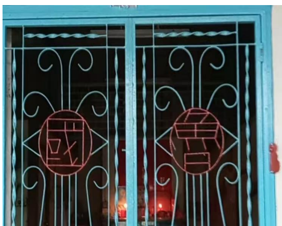
图 3.17: 哲仁新村鲁国堂号