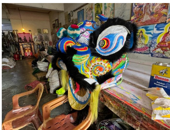
图五：郑永樑制作的东海狮款狮头（2024 年 8 月 1 日摄于怡保忠胜龙狮贸易艺术坊）

用单个灵光镜作装饰，并且与其他现代一样使用羊毛装饰。后来为了创造出更好和高档的的狮头，就将额头的单面灵光镜改成三个，并且以狼毛取代羊毛以分别出中档狮与高档狮。三面灵光镜分别被赋予“天”、“地”、“人”的含义。后来也开始有不同的狮头扎作师父开始借鉴制作三面灵光镜的狮头，如怡保忠胜龙狮贸易艺术坊或老夫子狮头扎作坊皆有借鉴出品“东海狮”款式的狮头（图五）。并且赋予三面灵光镜不同的含义，如怡保的狮头扎作者郑永樑赋予他“精”、“气”、“神”的含义。 42