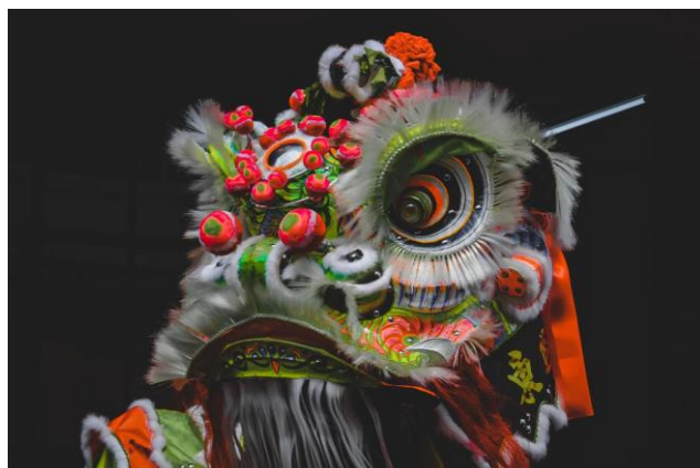
图二：传统“牙擦苏”刘备狮（2023 年 1 月 8 日摄于雪兰莪梳邦玄龙体育会）

礼结束后火化。也有人将毛色改成白色，寓意着“年老”。例如将关公狮的毛色改成白色，意味着“老关公”之意。