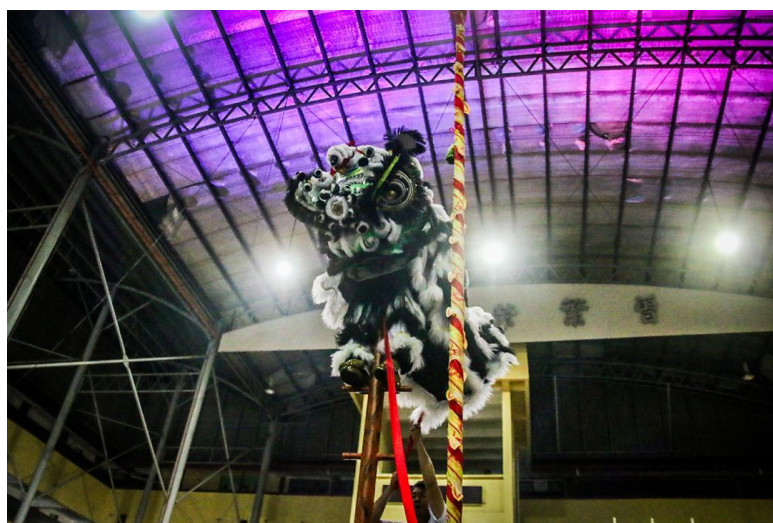
图七：爬上“将军栋”的传统南狮“牙擦苏”狮。（2024 年 6 月 23 日摄于雪兰莪万挠三育华小）

留存下来的影像记录可以观察到，南狮演绎者会使用长形板凳叠起以代表高山。在 1990 年的马来西亚金狮国际赛就已经可以看到现代高桩的雏形，这场比赛已经开始出现了一栋栋排列复杂，高低不一的梅花桩。早期的高桩并没有规定的形式，现代高桩的排列方式和高度都已经进行了统一的标准，不可随意更改。