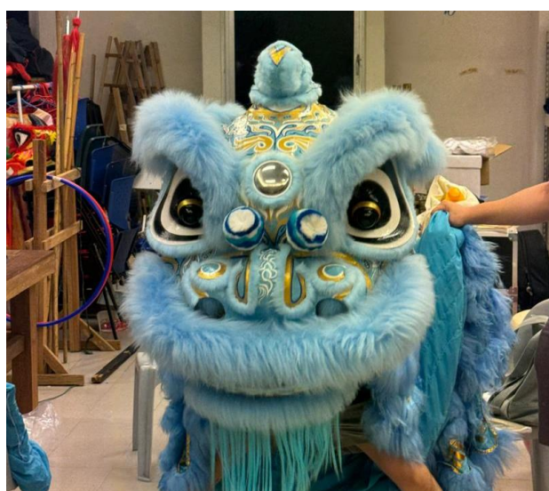
图六：创新色彩的羊毛鹤山狮（2024 年 11 月 11 日摄于金宝拉曼大学龙狮团仓库）