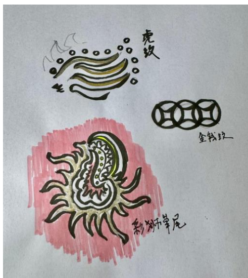
图一：传统南狮纹样图示。（上起为“虎纹”、“金钱纹”和“彩狮草纹”。）

南狮的制作过程主要分为五个步骤：扎、扑、画、装、缝。首先扎作师父会以竹篾或藤条扎出狮头的框架。而这时就会决定狮头的基本类别，例如尺寸比例等。传统南狮的狮头如“牙擦苏”或“港佛装”都会较为宽大。当狮头框架完成后，第二步就是分别以砂纸，纱布和玉扣纸扑在狮头框架上，又称为“扑狮”。 36 第三个步骤则是使用油彩在狮头上画出图样，传统上会在狮头上画出不同的带有中华文化含义的图形如“虎斑”、“草尾纹”、“唐草纹”、“金钱纹”和“蝙蝠纹”等（图一）。 37 然后就是开始装上不同的零件如眼珠、天灵盖、毛等。最后才是缝制和狮头颜色匹配的狮褙和狮裤。