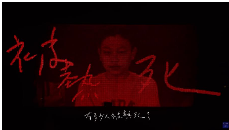
图片 2：2016 年苏打绿小巨蛋演唱会演唱〈彼得与狼〉片段截图

(资料来源：苏打绿 sodagreen, 《苏打绿 sodagreen - 〈御花园@小巨蛋 2016/12/02〉》, Youtube, 2016 年 12 月 9 日, https://www.youtube.com/watch?v=Maad0JUsiw8 。)