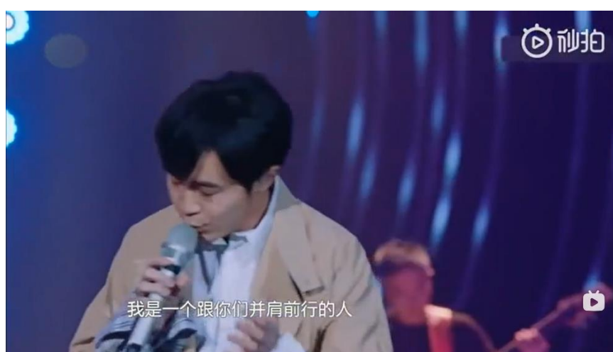
图片 3-7：《歌手 2019》第十期中对吴青峰的赛前采访片段截图

（资料来源：歌手 2019，《歌手 2019 年第 10 期：“灵魂歌唱家”龚琳娜终极补位 齐豫吴青峰正能量出击》，芒果 TV，2019 年 3 月 15 日。