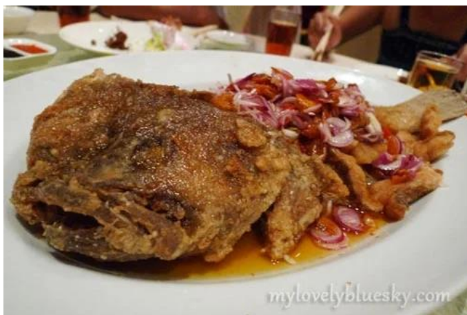
照片 3-15: 婚宴鱼类（年年有余）