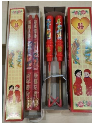
照片 3-6：结婚时用的龙凤烛，左边的是福建人惯用的龙凤烛，右边则是怡保广府人惯用的龙凤烛，两者分别在于蜡烛的“脚”。

拍摄日期：2023 年 3 月 1 日