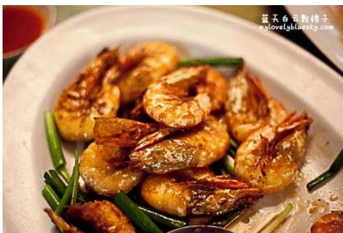
照片 3-16: 鼓油皇煎鲜明虾（喜结良缘笑哈哈）