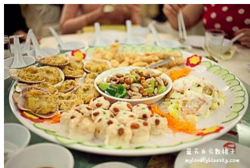
照片 3-13: 婚礼晚宴头盘（五福临门齐欢庆）