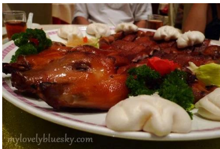
照片 3-17: 港式烤乳猪