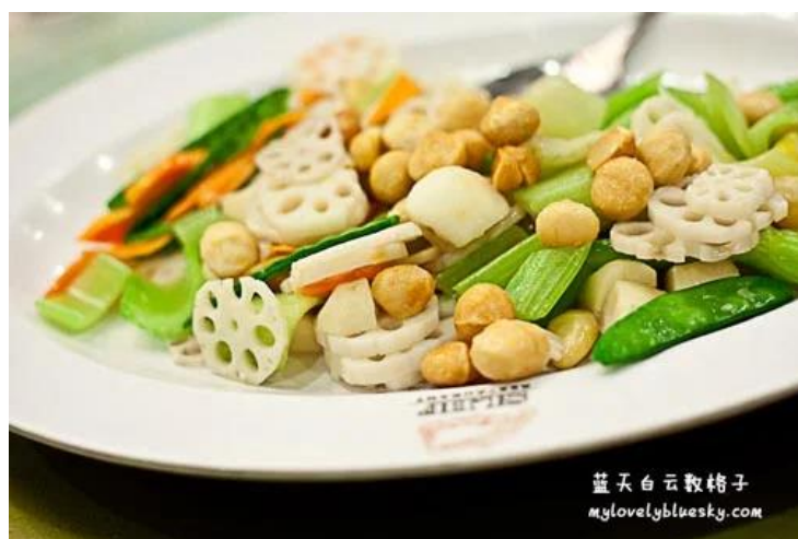
照片 3-18: 婚宴蔬菜类（百子千孙福满堂）