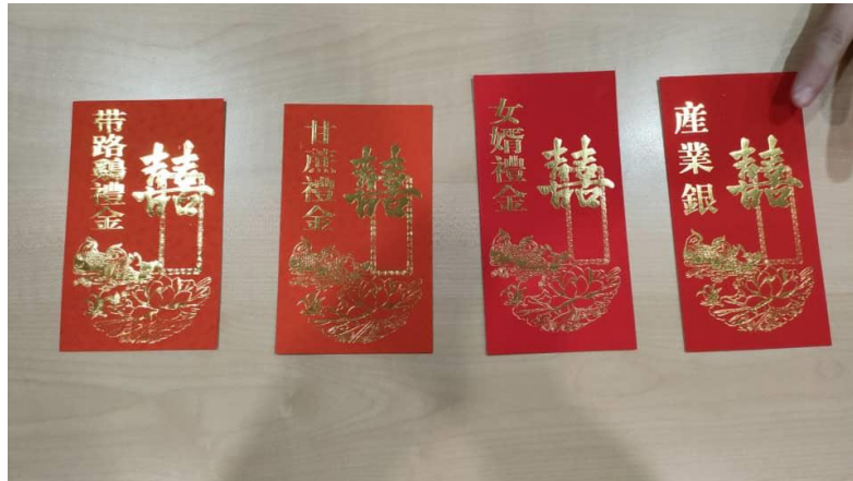
照片 3-3: 广府人结婚时, 女方准备给男方的回礼红包封, 包括: 带路鸡礼金、甘蔗礼金、女婿礼金、产业银礼金。