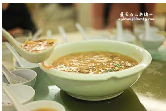
照片 3-14: 鱼翅羹汤（八仙降临报喜讯）