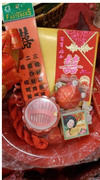
照片 3-12: 上头礼包 拍摄日期: 2023 年 3 月 1 日