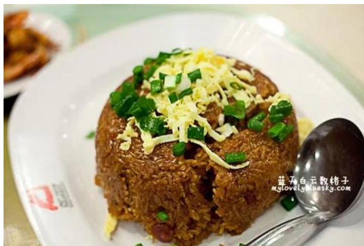
照片 3-19: 金钩虾米糯米饭