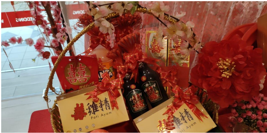
照片 3-9: 出嫁当日，女方需准备的回礼礼篮。 拍摄日期：2023 年 3 月 1 日