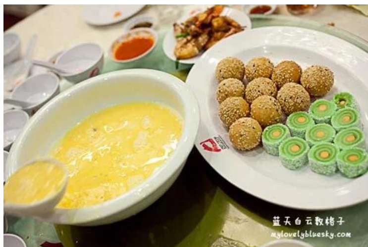
照片 3-20: 婚宴的两道甜品（甜蜜美点双辉映彩龙珠杨枝金露）