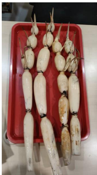
照片 3-7：过大礼用的发芽莲藕