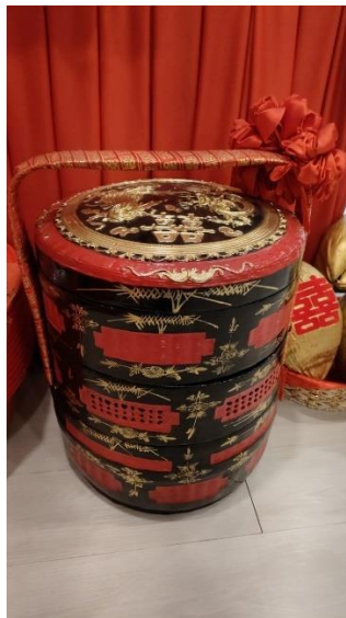
照片 3-4: 过大礼用的篮子款式之一