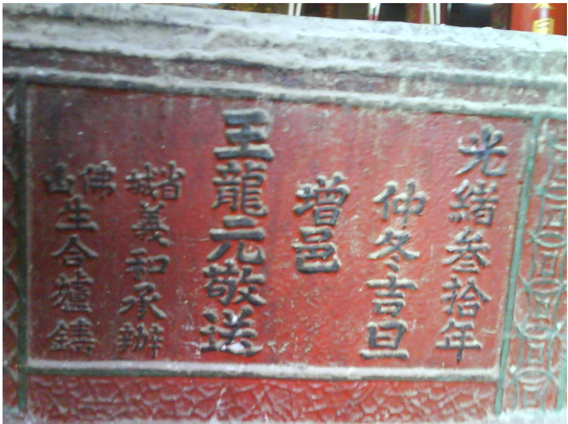
图（2）增城弟子的捐献