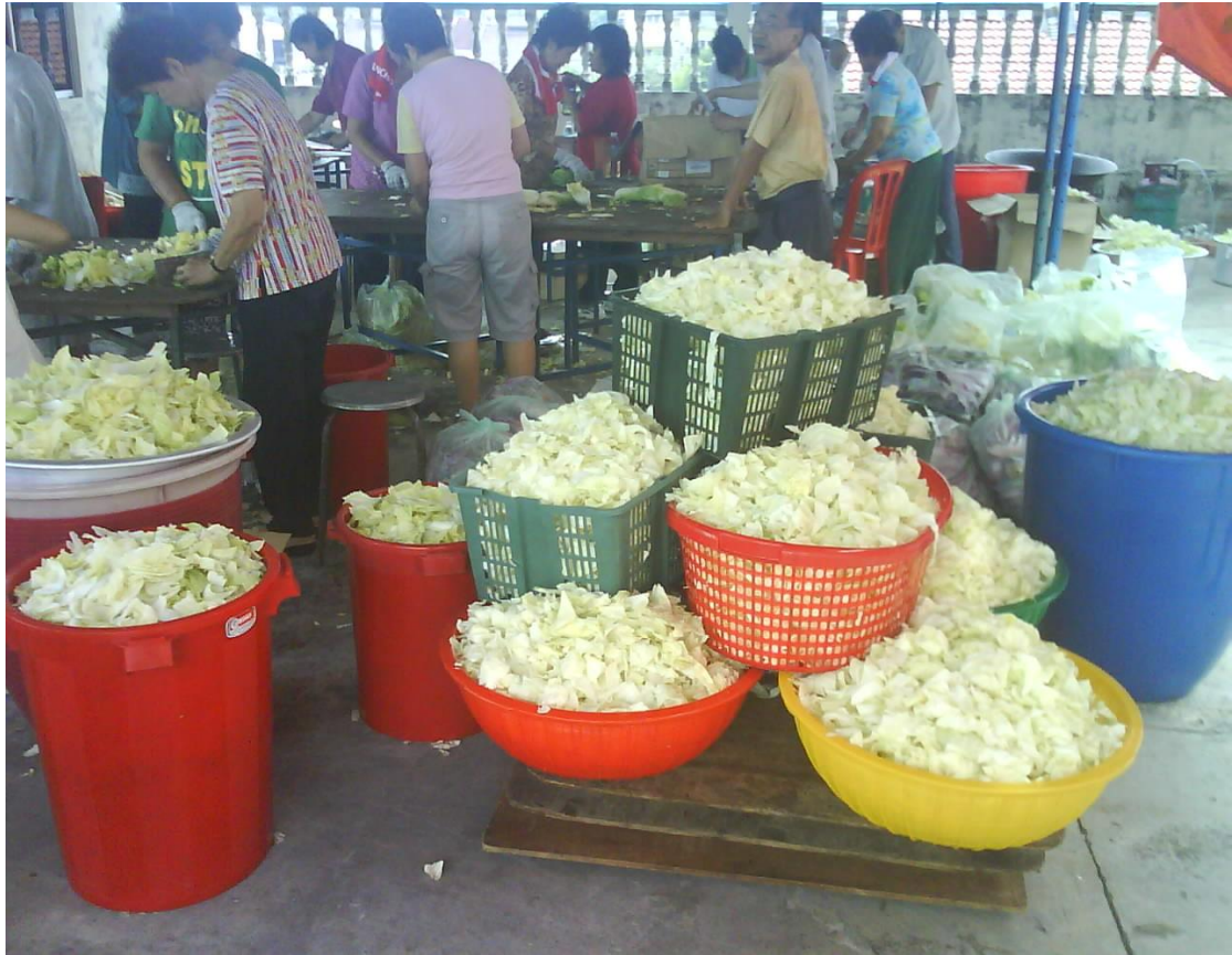
图（3）六月十九观音诞前夕膳食准备工作