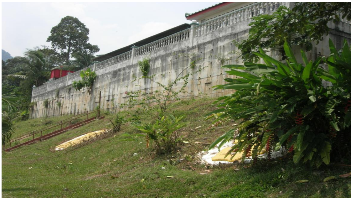
图（4）古庙旁保留着的“古庙公园”四个大字