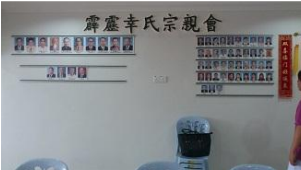
捐款建会基金 RM500 或是以上的幸氏宗亲们瓷像