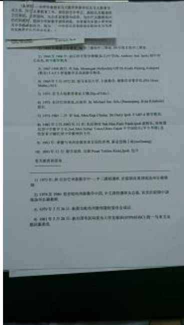
幸展政先生的个人简介